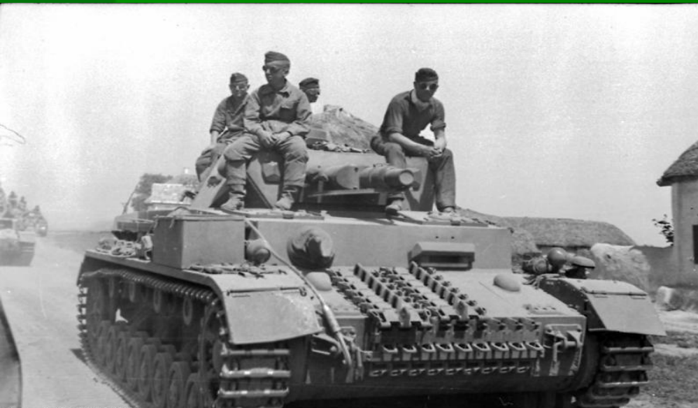
1. Juni 1942

...У тебя нет сердца и нервов, на войне они не нужны. Уничтожь в себе жалость и сострадание, убивай всякого русского, не останавливайся, если перед тобой старик или женщина, девочка или мальчик. Убивай, этим самым спасешь себя от гибели, обеспечишь будущее своей семьи и прославишься навек.