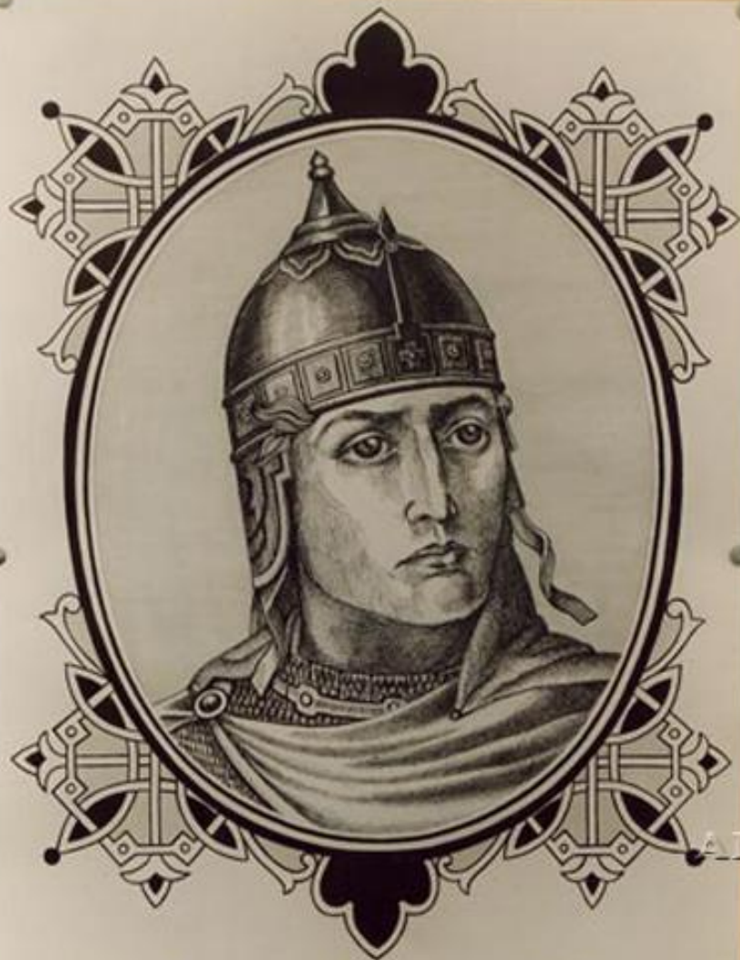
ЦАРЬ ІОАННЪ ІV