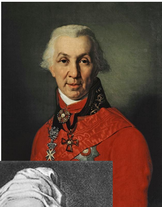
Василий Андреевич Жуковский