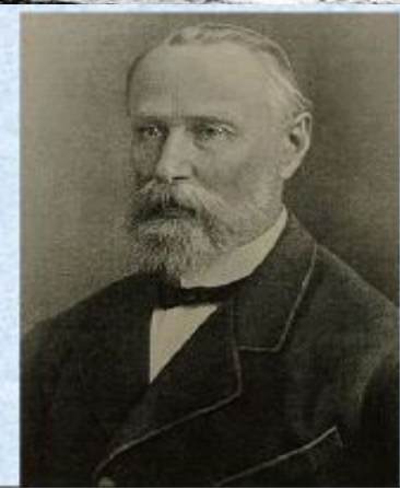
Михаил Никифорович Катков,

министр внутренних дел Российской империи в 1882 – 1889 гг.