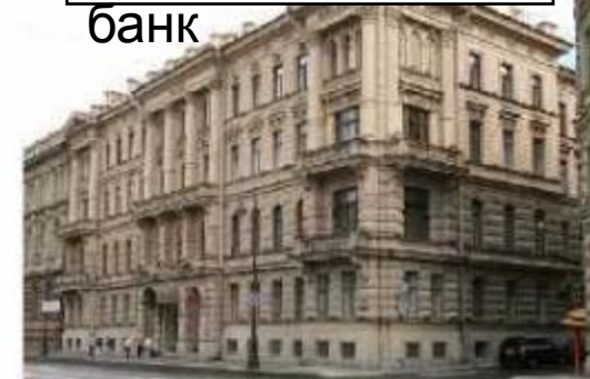
Адмиралтейская набережная, 10

Кредиты крестьянам давались на срок до 51 года при процентной ставке от 0 до 4%.