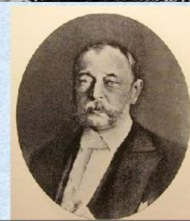
Дмитрий Андреевич Толстой,

обер-прокурор Святейшего Синода в 1880 – 1905 гг.