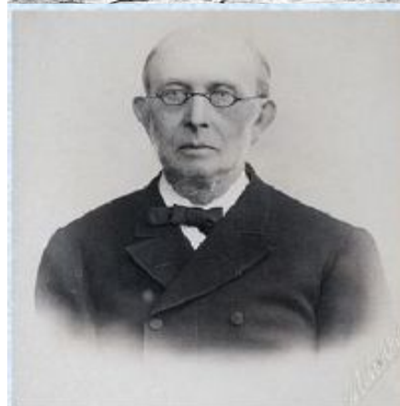
Константин Петрович Победоносцев,

обер-прокурор Святейшего Синода в 1880 – 1905 гг.