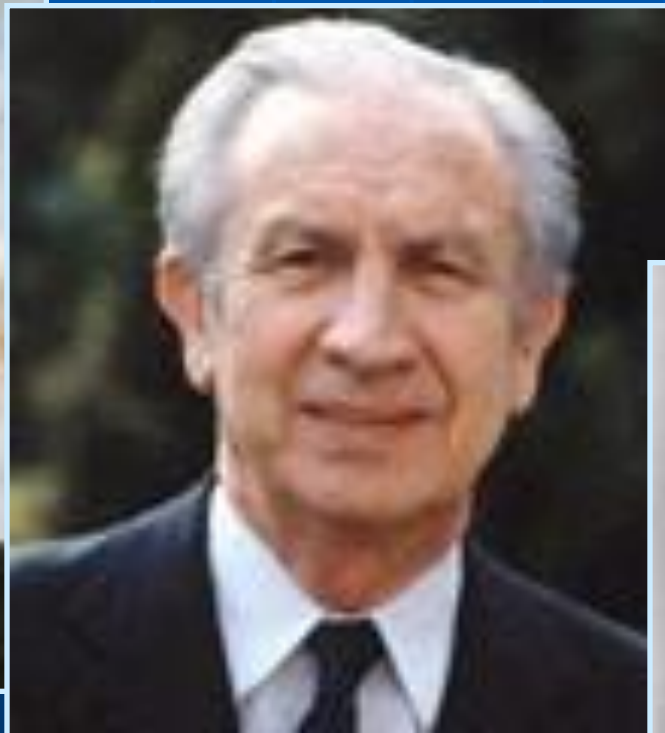
Хуан Антонио Самаранч