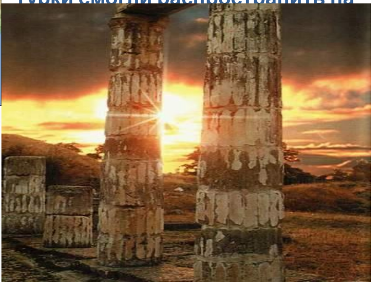
(Пантикапей – столица Боспорского царства)

В Средние века Кубань имеет очень бурную историю: какие только племена и народы не ступали на эту землю - основывали свои города-колонии древние греки, вторгались полчища гуннов, хазар, печенегов, половцев и монголо-татар. Были и колонии итальянских купцов, поддерживающих тесные связи с адыгейскими племенами. Позже турки смогли распространить на