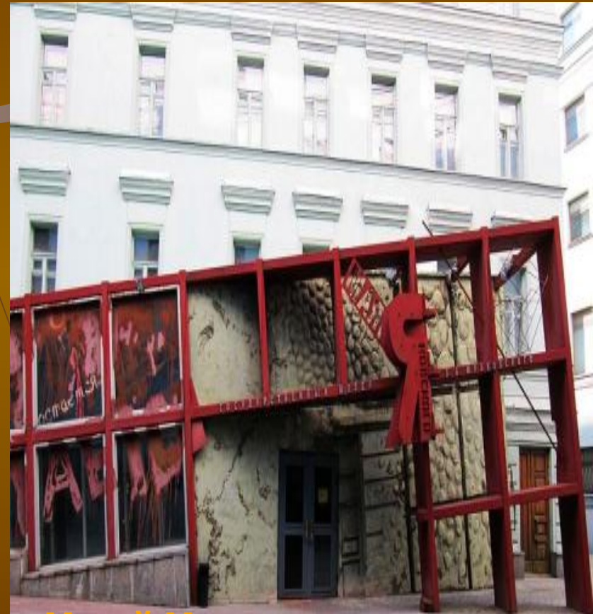
Музей Маяковского в Москве.

Как и с Есениным, самоубийство Маяковского вызвало различную реакцию и множество версий. Одной из мишеней стала 22-летняя актриса МХАТа Вероника Полонская. Известно, что Маяковский просил ее стать женой. Именно она была последним человеком, видевшим поэта живым. Однако показания актрисы, соседей по квартире и данные следствия свидетельствуют, что выстрел прогремел сразу после того, как Полонская вышла из комнаты Маяковского. Значит, стрелять она не могла.