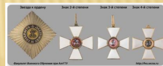
Звезда и знаки к ордену Св. Георгия