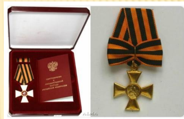
Орден Святого Георгия, утвержденный Екатериной II

Орден вручался исключительно за воинские подвиги. А цвета войны – это цвет пламени, то есть оранжевый, и дыма – черный.