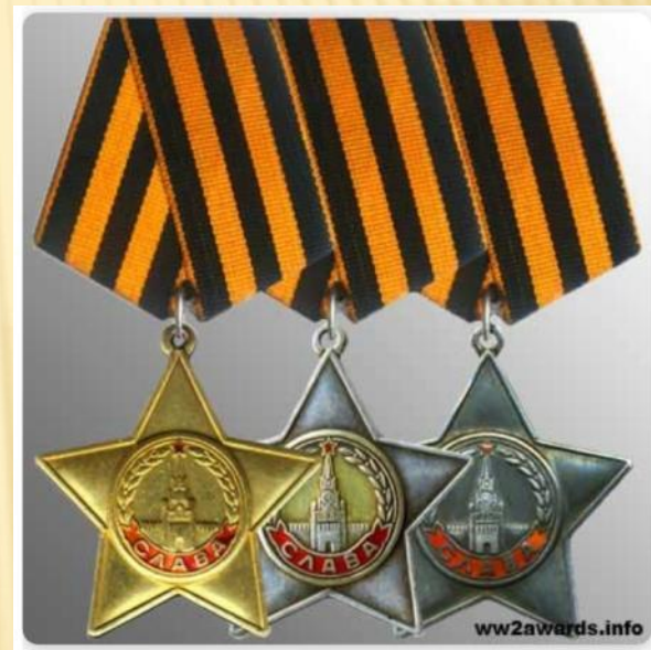
Орден Славы 3-х степеней

Затем Георгиевская лента, подтверждая традиционные цвета российской воинской доблести, украсила многие современные российские наградные медали и знаки.