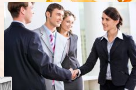
В общественных местах