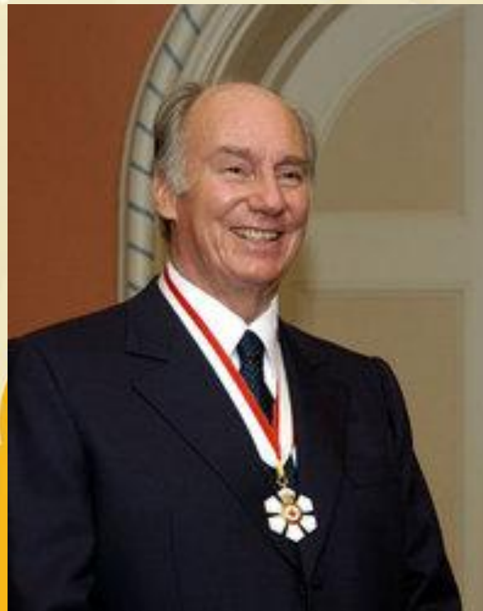
Принц Керим Ага – Хан

Исмаилизм — религиозное движение в шиитской ветви ислама. Возникло в конце VIII в. Имеет свою иерархию имамов. Титул имама — главы общины исмаилитов — Ага-хан — передаётся по наследству. Нынешним исмаилитским имамом является Ага Хан IV. Исмаилитов в наше время около 15 миллионов.