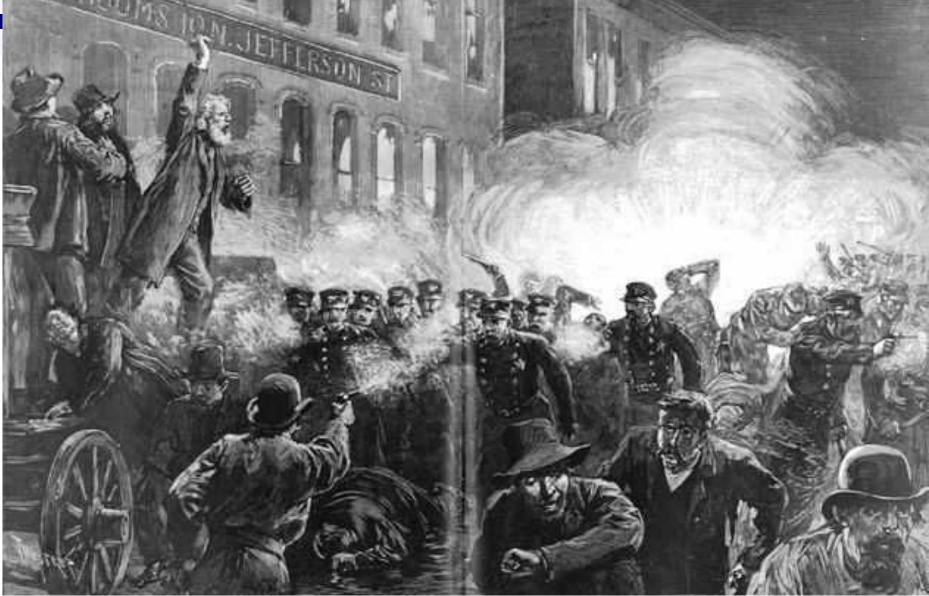
Столкновения рабочих с полицией в Чикаго, 1886