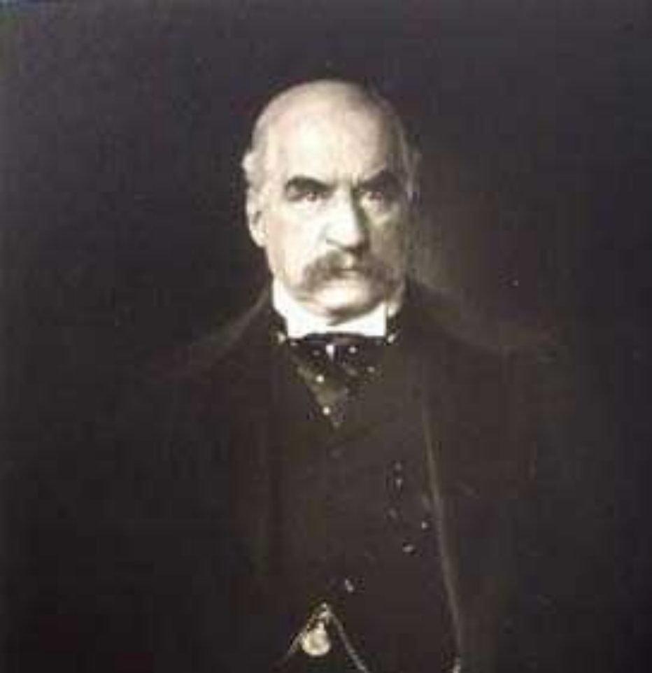
Д. Морган, основатель одной из крупнейших американских компаний