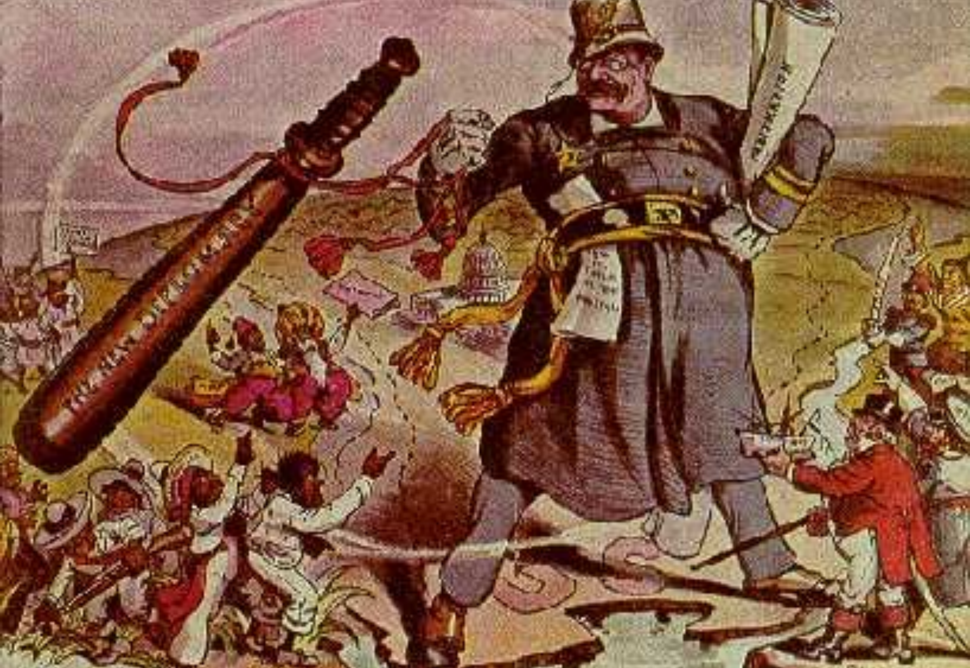
«Политика большой дубинки». Карикатура