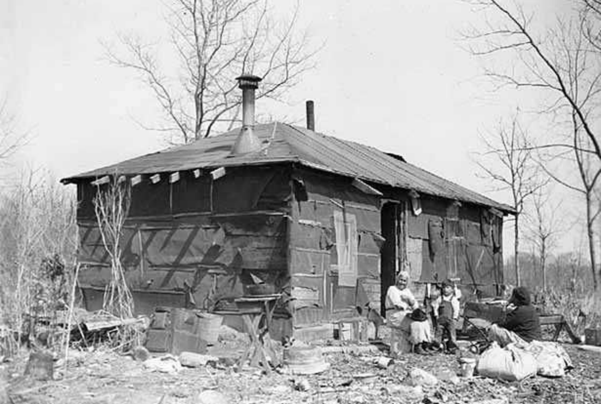
Дома индейцев в резервации, 1925