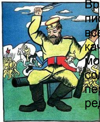
Плакат 1917 г.

В текстах превалирует негативное отношение к немцам и австро-венграм. Презрение, не-ненависть к ним особенно хорошо проявляется в эпитетах, которыми одевают врагов русские: «проклятые», «распроклятые», или собирательный образ — «немецкий пёс». Через экспрессивные этнонимы - австрияки, немчур, неметчина - также выражается пренебрежительное отношение к врагам.