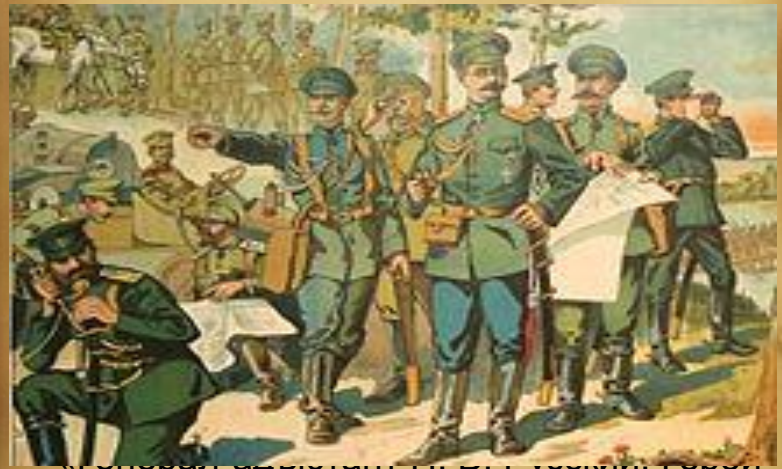
«Генерал Брусилов и его русский Герой Львова». Почтовая открытка.

Генерал Брусилов бравый Нас повёл на немцев лавой, Русский храбрый генерал Его к Львову уже гнал.