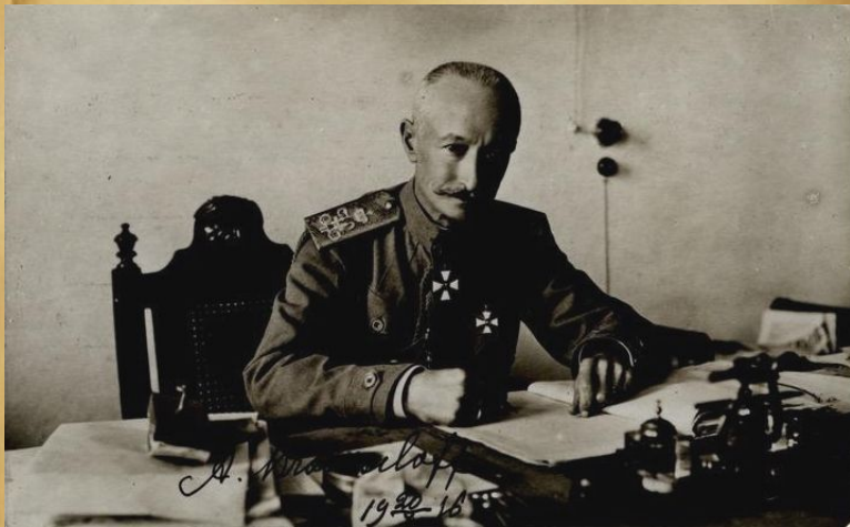
Генерал Алексей Брусилов в 1916 г.

Уже в самом начале войны частушка начинает создавать образ идеального командира, русского полководца – храбр-реца и удальца, «отца солдат». С этим образом фольклорная традиция связывает имена самых разных генералов русской армии.