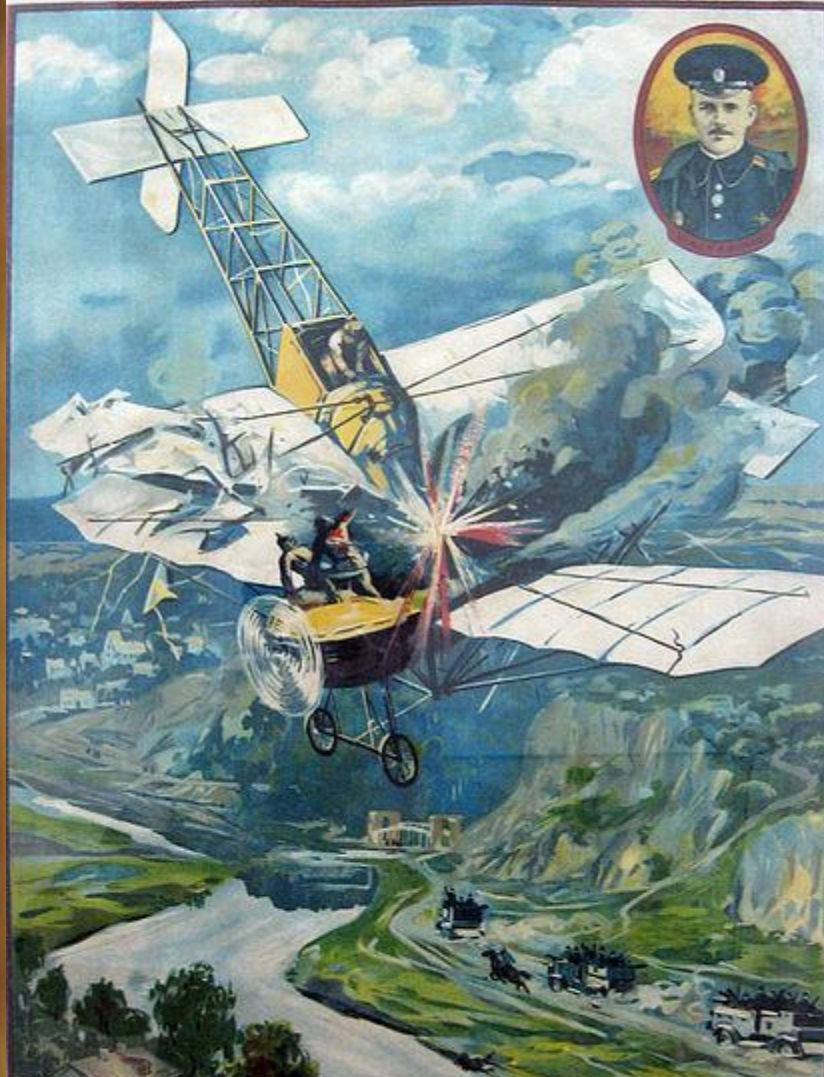
Плакат времён Первой мировой войны «Подвиг и гибель лётчика Нестерова»