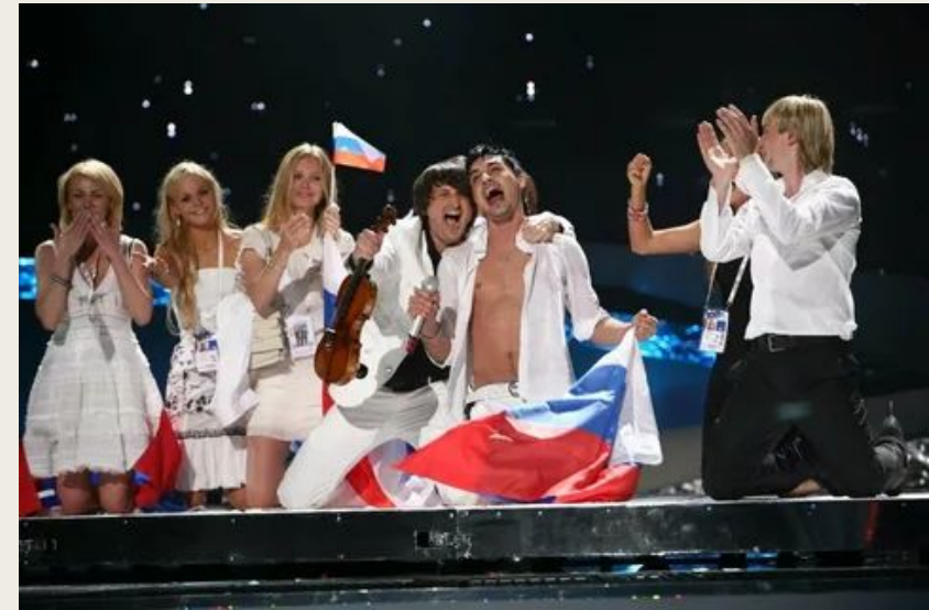
Победа Д. Билана на Евровидении 2008