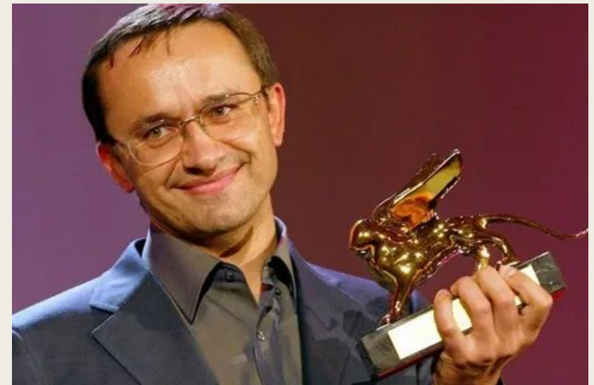
А. Звягинцев на Венецианском кинофестивале