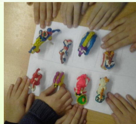
Наши первые работы