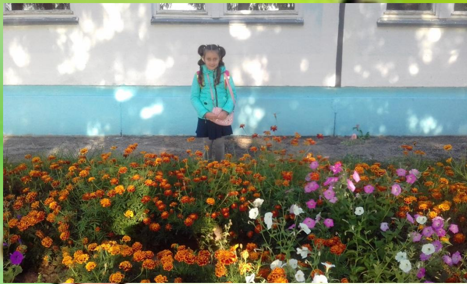
Наша школьная клумба.