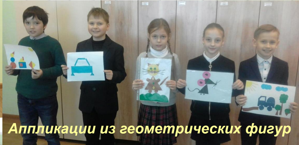
Аппликации из геометрических фигур