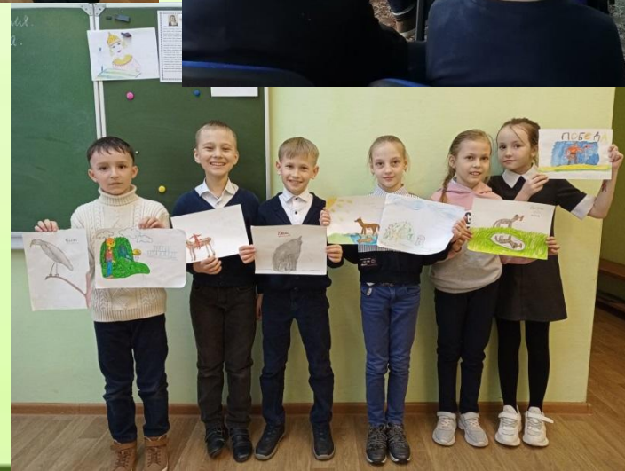
Чтение рассказов И. Яковлева и конкурс рисунков