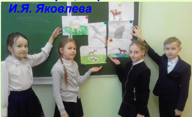
Иллюстрация рассказов И.Я. Яковлева