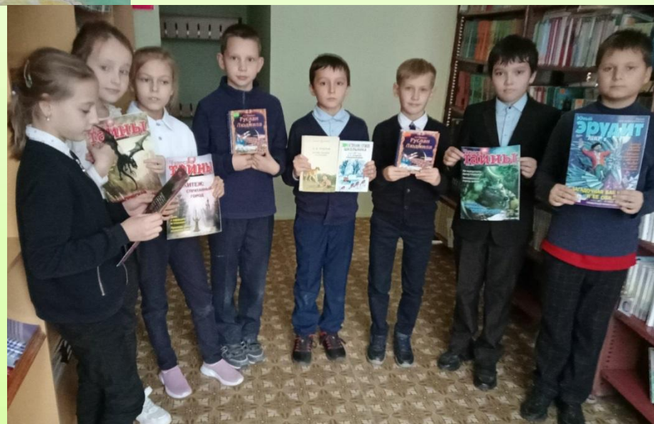
Самый читающий класс!