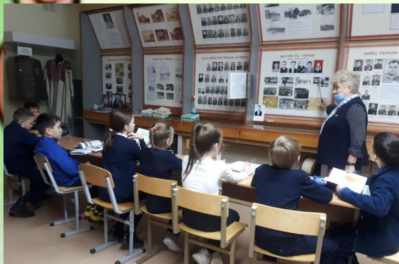
На занятии в школьном краеведческом музее.