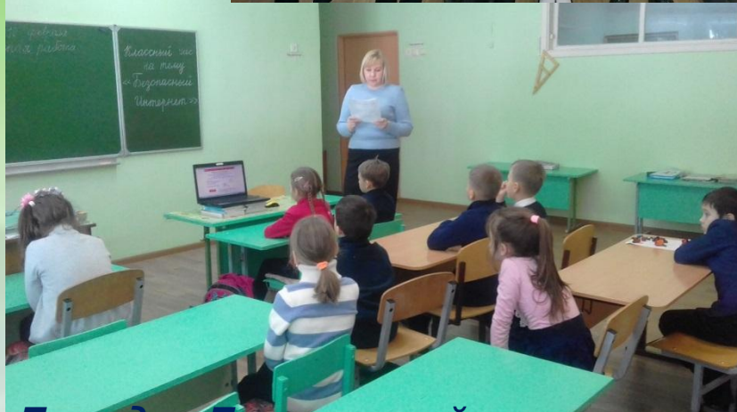
Беседа «Безопасный интернет»