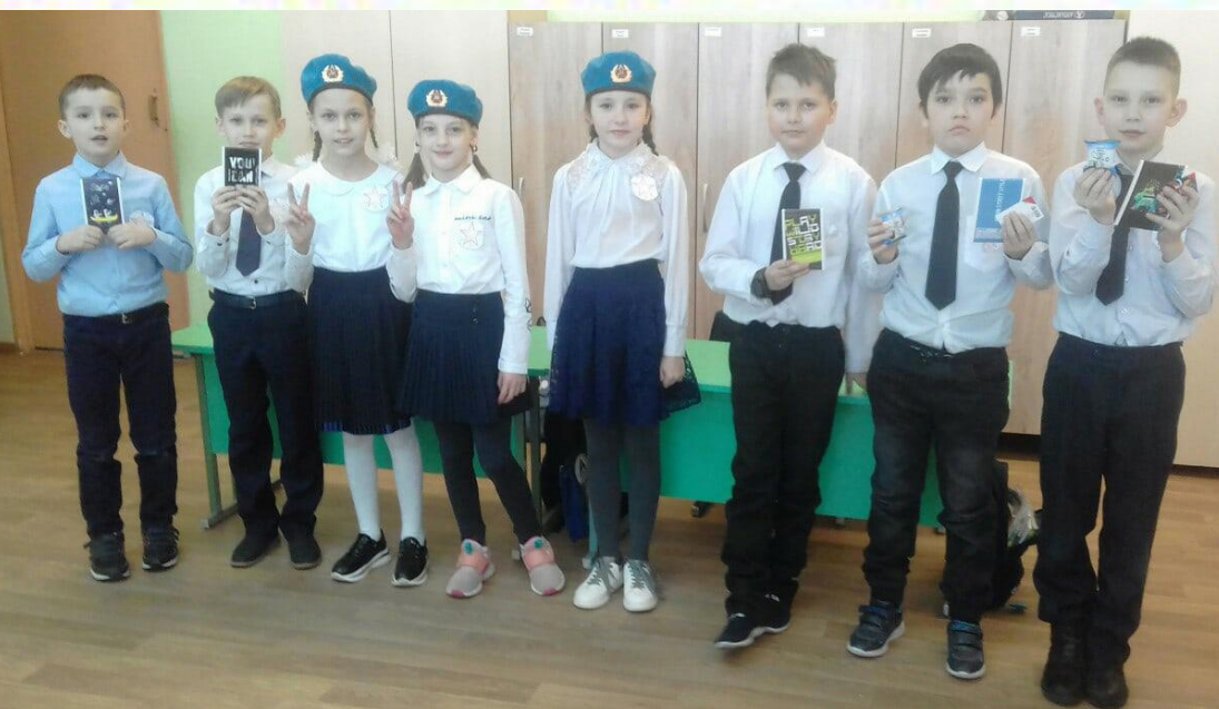
Конкурс «А, ну-ка, мальчики!»