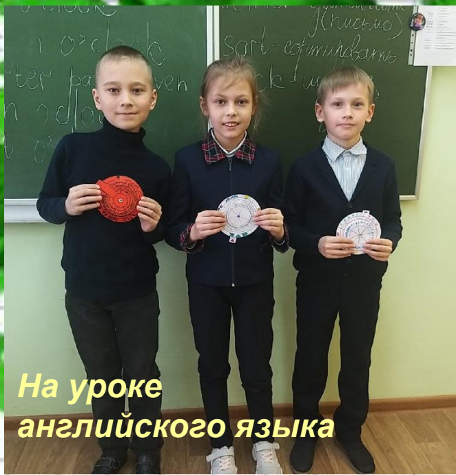
На уроке английского языка

Мы ребята просто супер! Мы ребята просто класс!!!