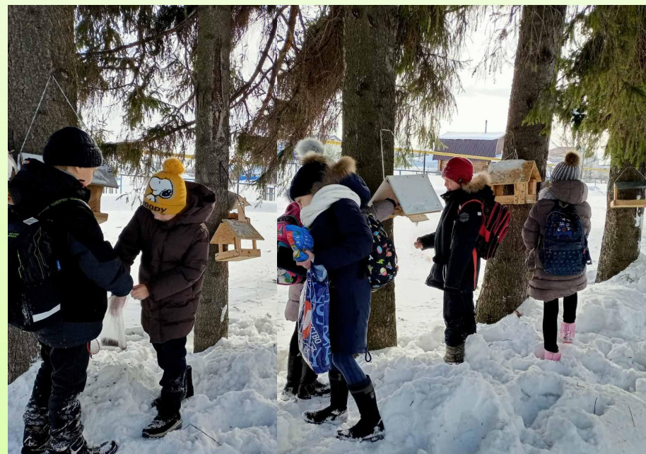
Кормим зимующих птиц