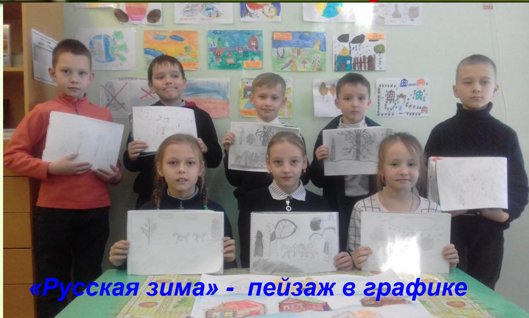
«Русская зима» - пейзаж в графике