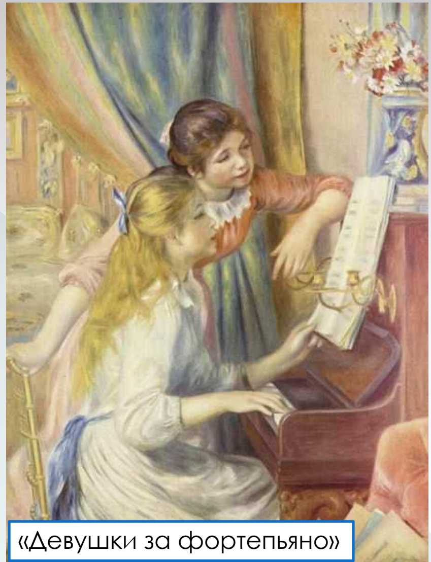
«Девушки за фортепьяно»

В начале 90-х годов в ренуаровском искусстве произошли новые перемены. В живописной манере появилась переливчатость цвета, отчего этот период иногда именуют «перламутровым»