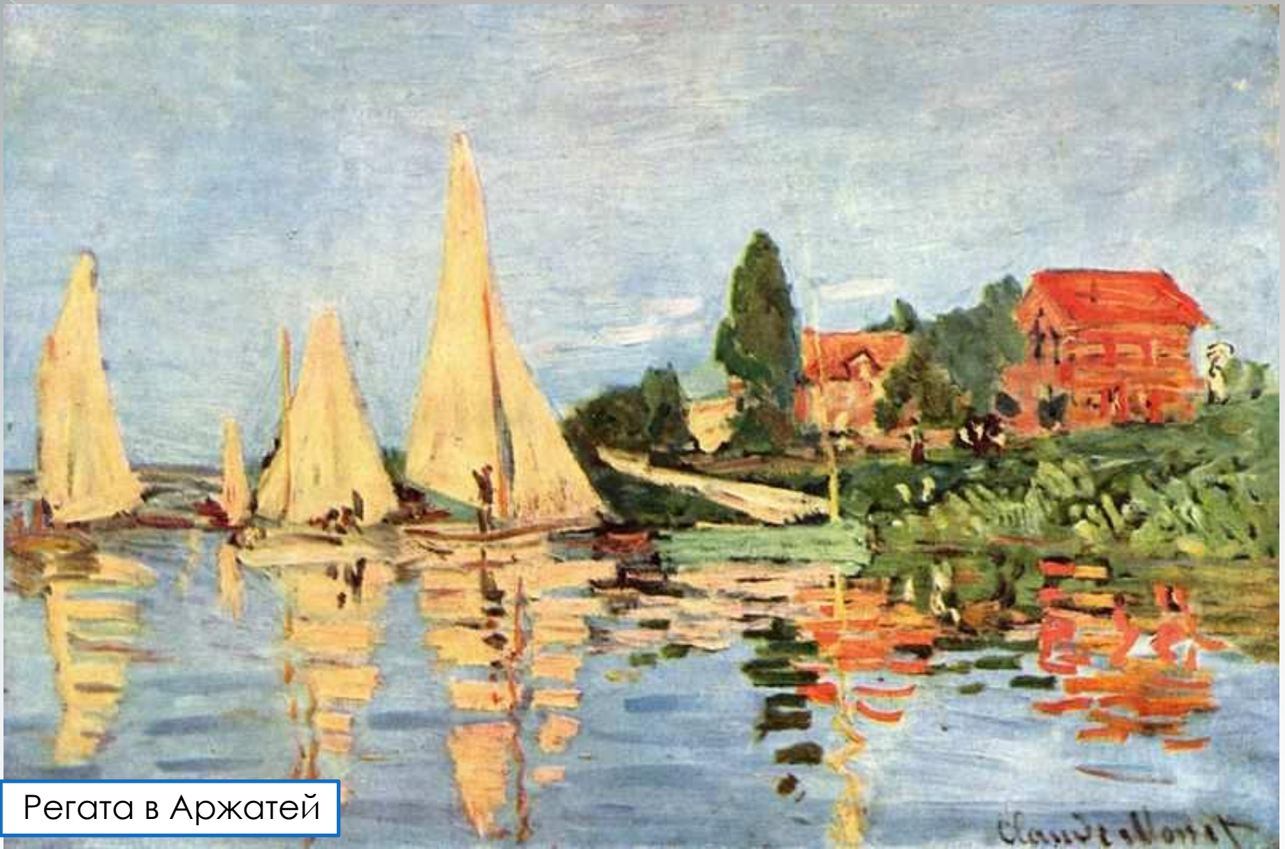
Регата в Аржате