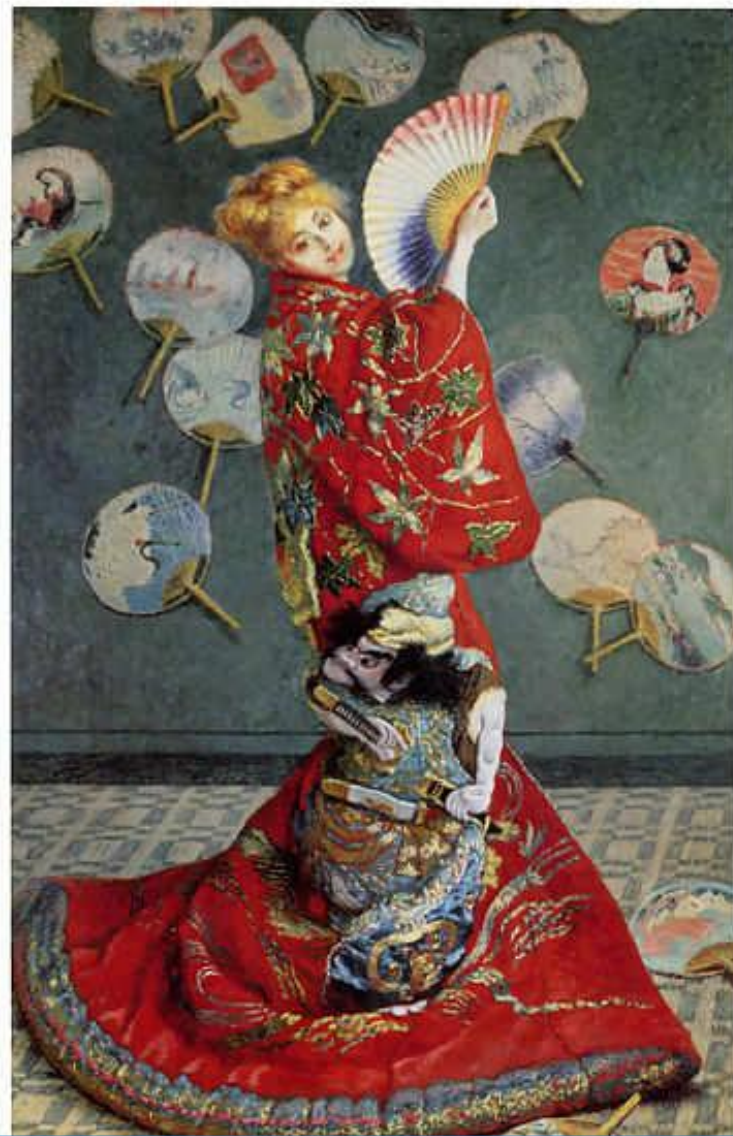
Камилла в японском кимоно