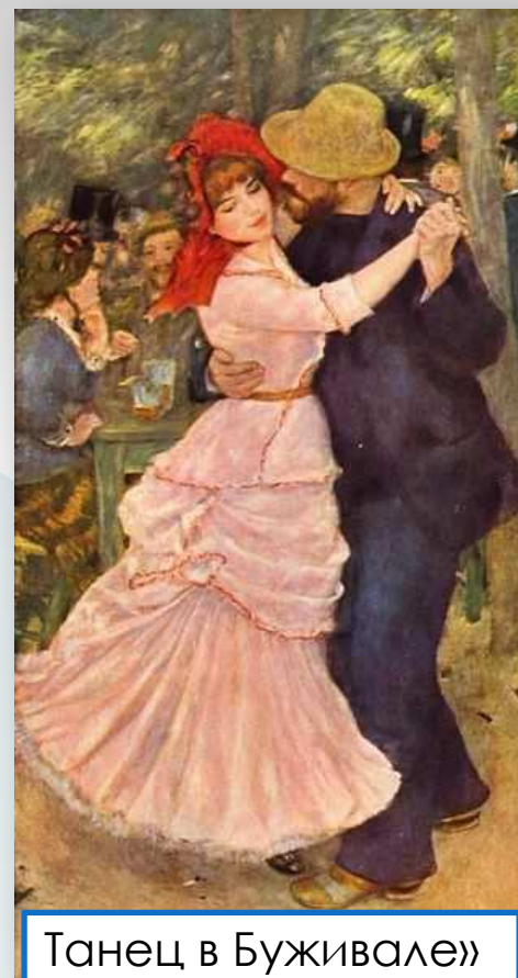
«Танец в Буживале»