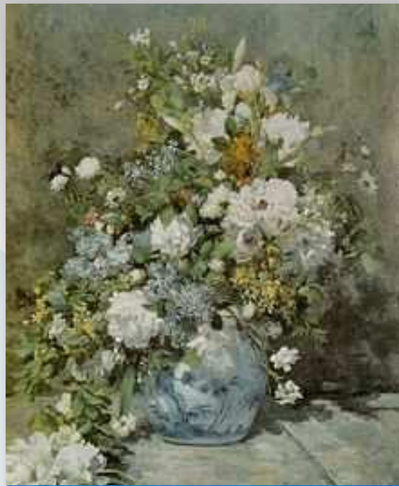
Огюст Ренуар. Весенний букет.