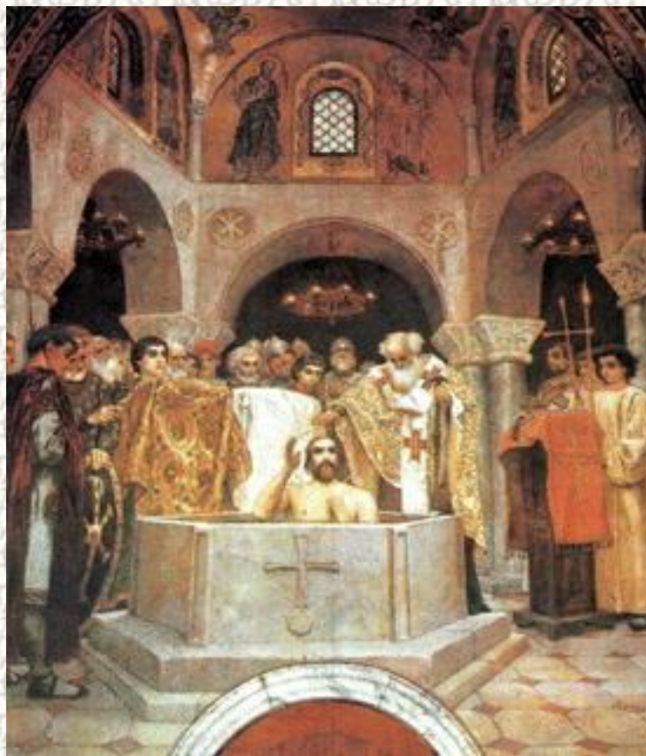
В.Васнецов. Крещение князя Владимира.

В 988 году был предпринят поход Владимира на византийский г. Корсунь (Херсонес). После длительной осады город был взят войском Владимира. Византийским императорам Василию и Константину был поставлен ультиматум: или они выдают свою сестру Анну замуж за Киевского князя, или Владимир идёт войной на Византию. Однако императоры поставили Владимиру своё условие: чтобы жениться на византийской царевне Анне, он должен принять христианство