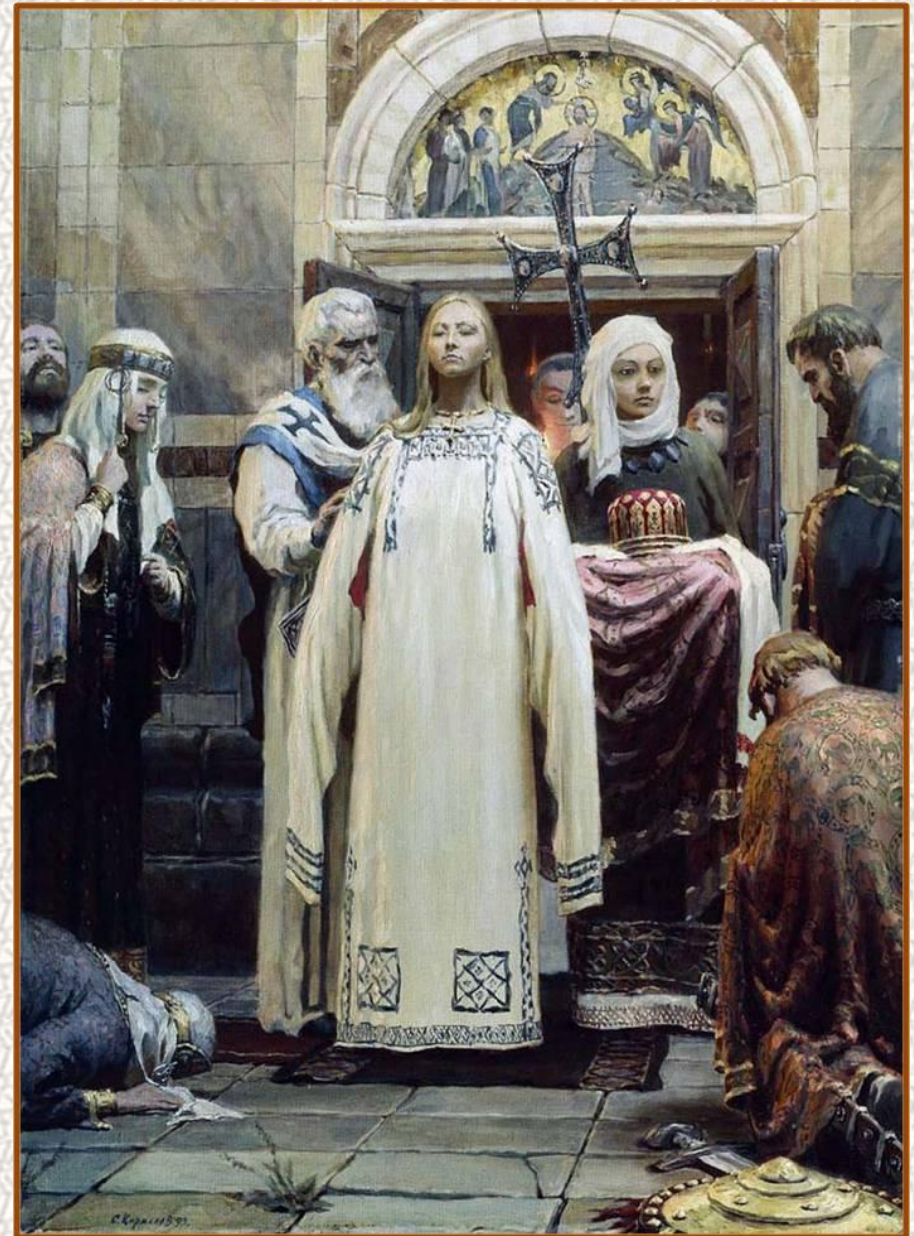
Крещение кн. Ольги.

Вспомнили бояре и о княгине Ольге: «Если бы плох был закон греческий, то не приняла бы его бабка твоя Ольга, а была она мудрейшей из всех людей».