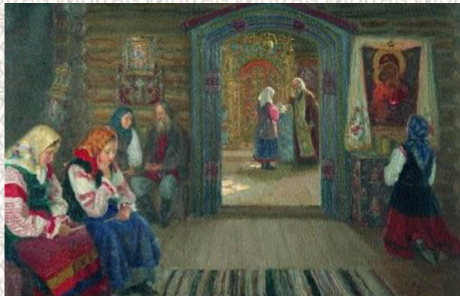
После крещения Руси.