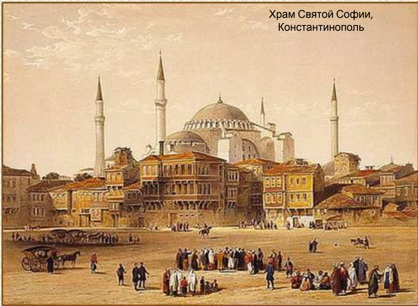
Храм Святой Софии, Константинополь

А церковная служба у греков в главном храме Константинополя, древнем Софийском соборе, произвела на них неизгладимое впечатление.