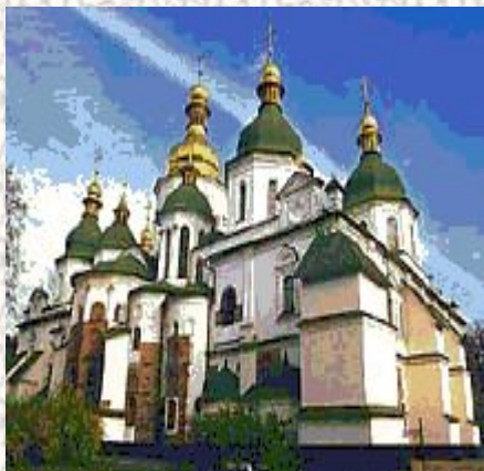
Киев. Софийский собор