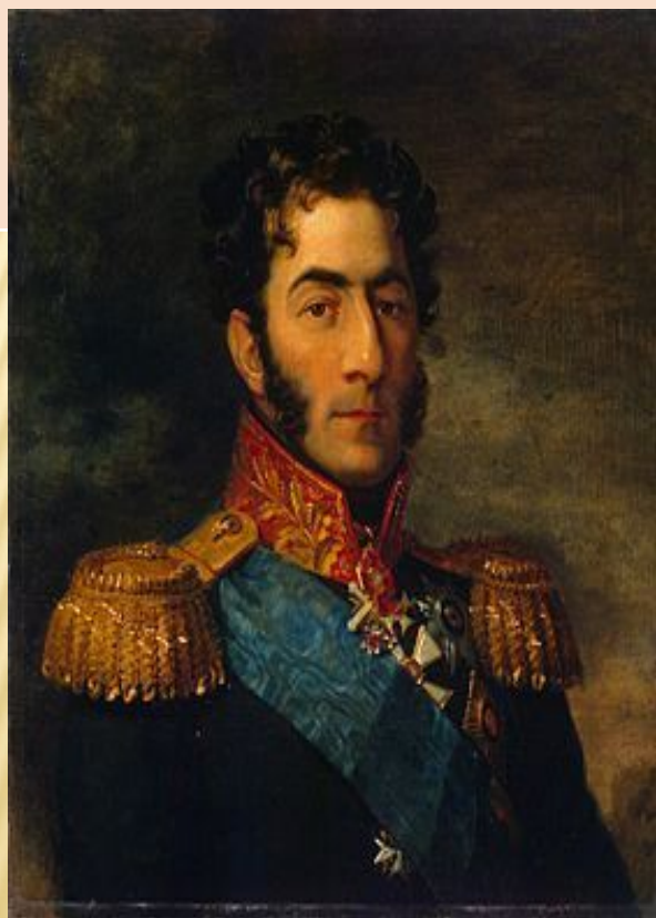
Пётр Иванович Багратион

Героические защитники флешей отразили семь атак неприятеля. Тяжело ранен П.И.Багратион, русские оставили укрепления. Наполеон не добился своей главной цели – французы не смогли прорвать линию обороны русских.