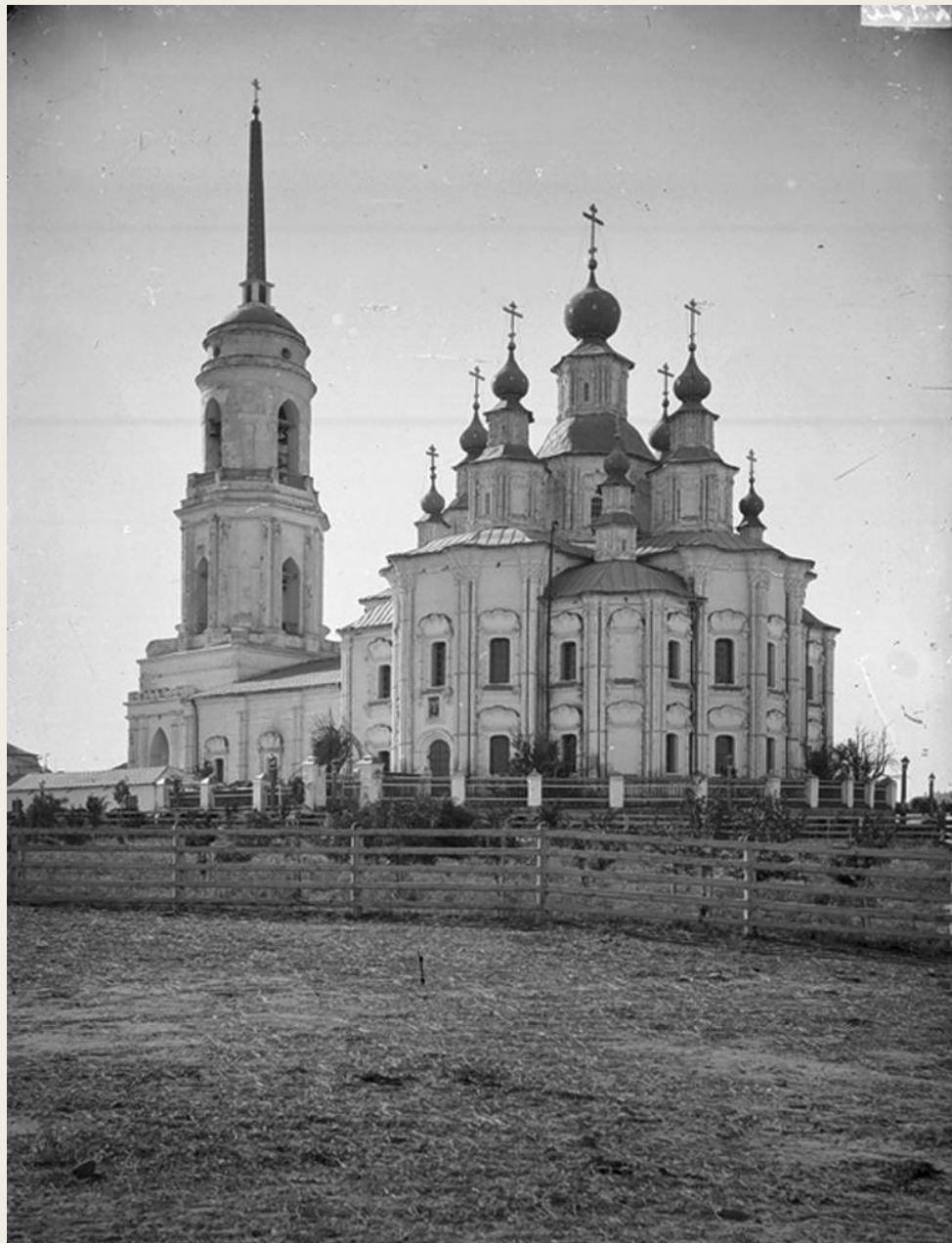
Успенский собор на станке Дубовка