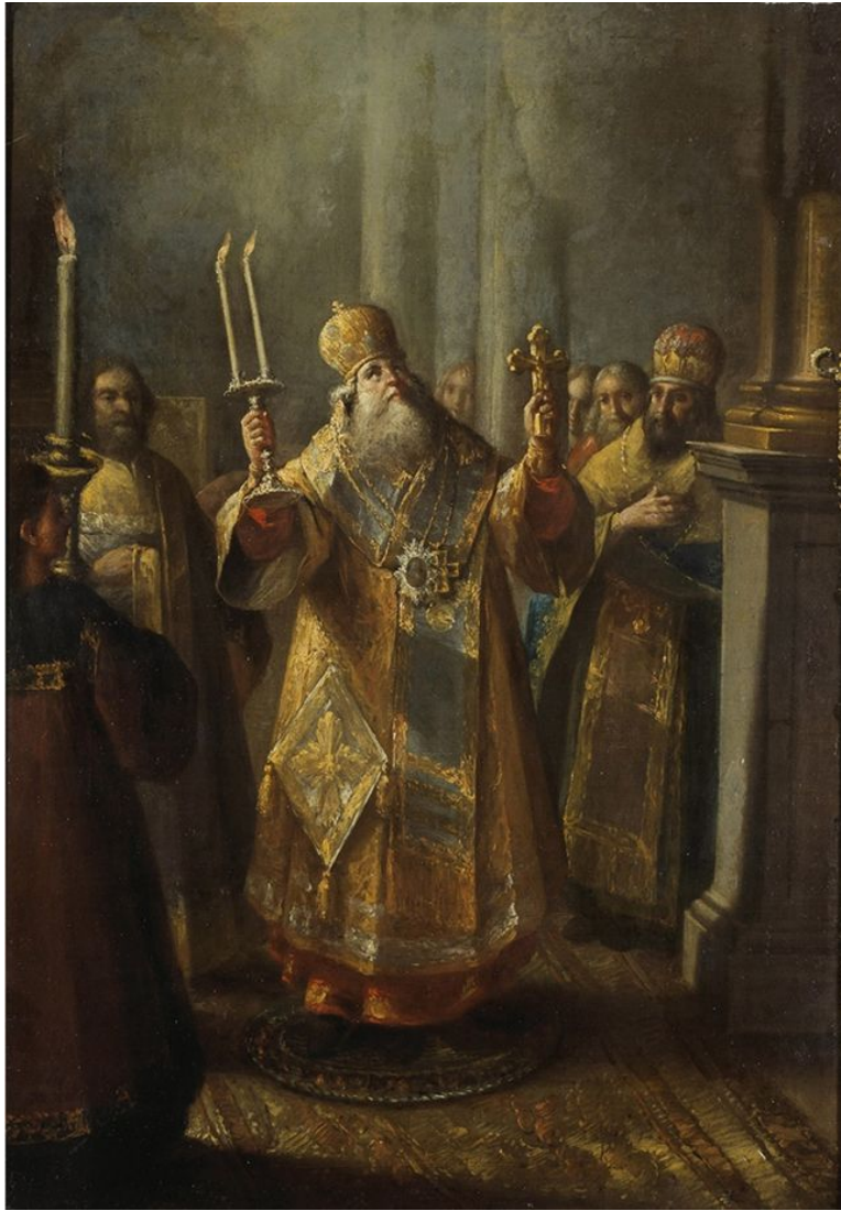
Бельский И. Архиерей во время служения литургии.

До 1589г. главой Русской православной церкви являлся митрополит Московский и всея Руси. Под его властью находилось 11 епархий. Во главе каждой епархии стоял архиерей, имевший духовных и светских слуг, которые управляли хозяйством и земельными владениями, собирали доходы и судили подчиненное духовенство и мирян.