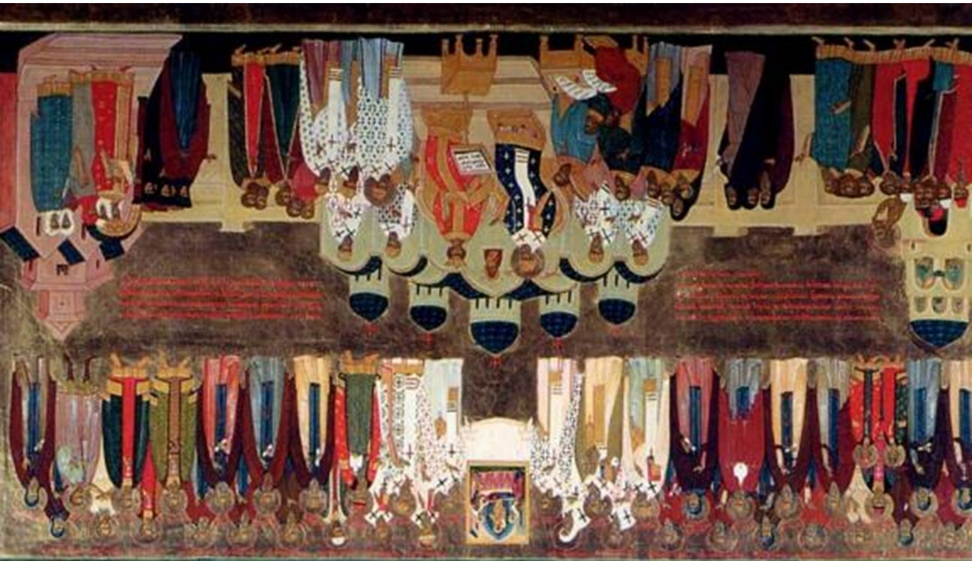
Церковные соборы 1547,1549гг. Современная икона