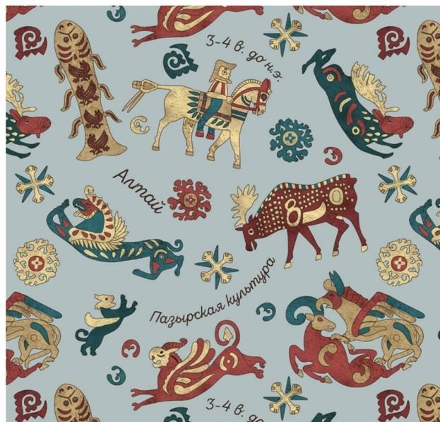
Собирательный орнамент Алтайского края с графическими элементами пазырыкцев