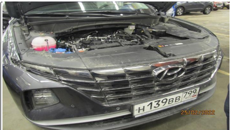
Общий вид авто