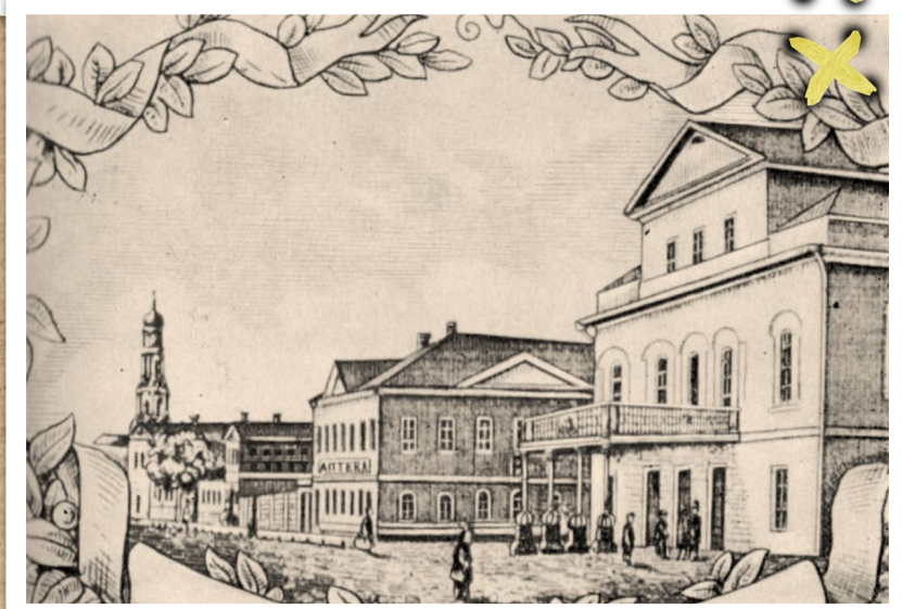
Види Харкова, Харківський театр, 1840