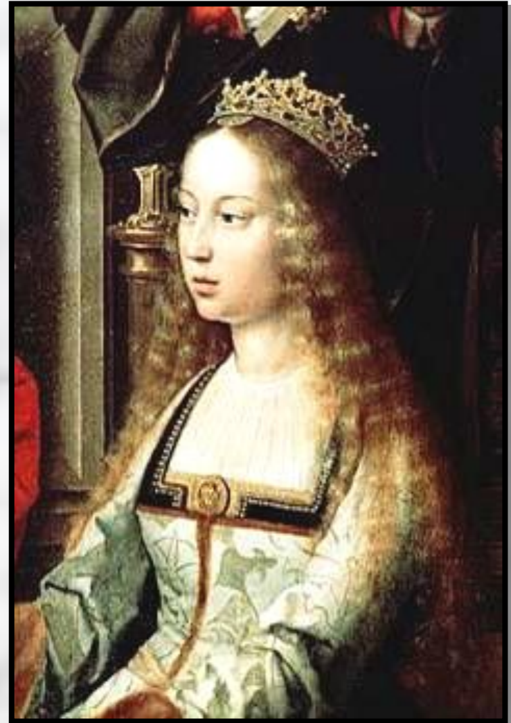
Фердинанд и Изабелла