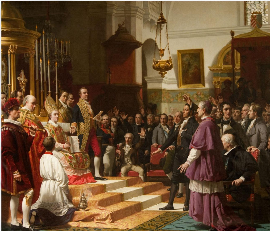
Кортесы в Испании

Кортесы в Кастилии, как и Генеральные штаты во Франции, делились на три палаты. Они утверждали новые налоги и участвовали в издании законов. Кастильские кортесы были первым в Европе парламентом с участием крестьян.