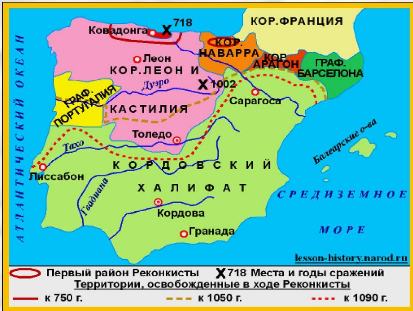
Карта. Реконкиста на Пиренейском полуострове.

В ходе Реконкисы образовались королевства Кастилия (в переводе - «Страна замков»), Арагон , Наварра , Португалия .