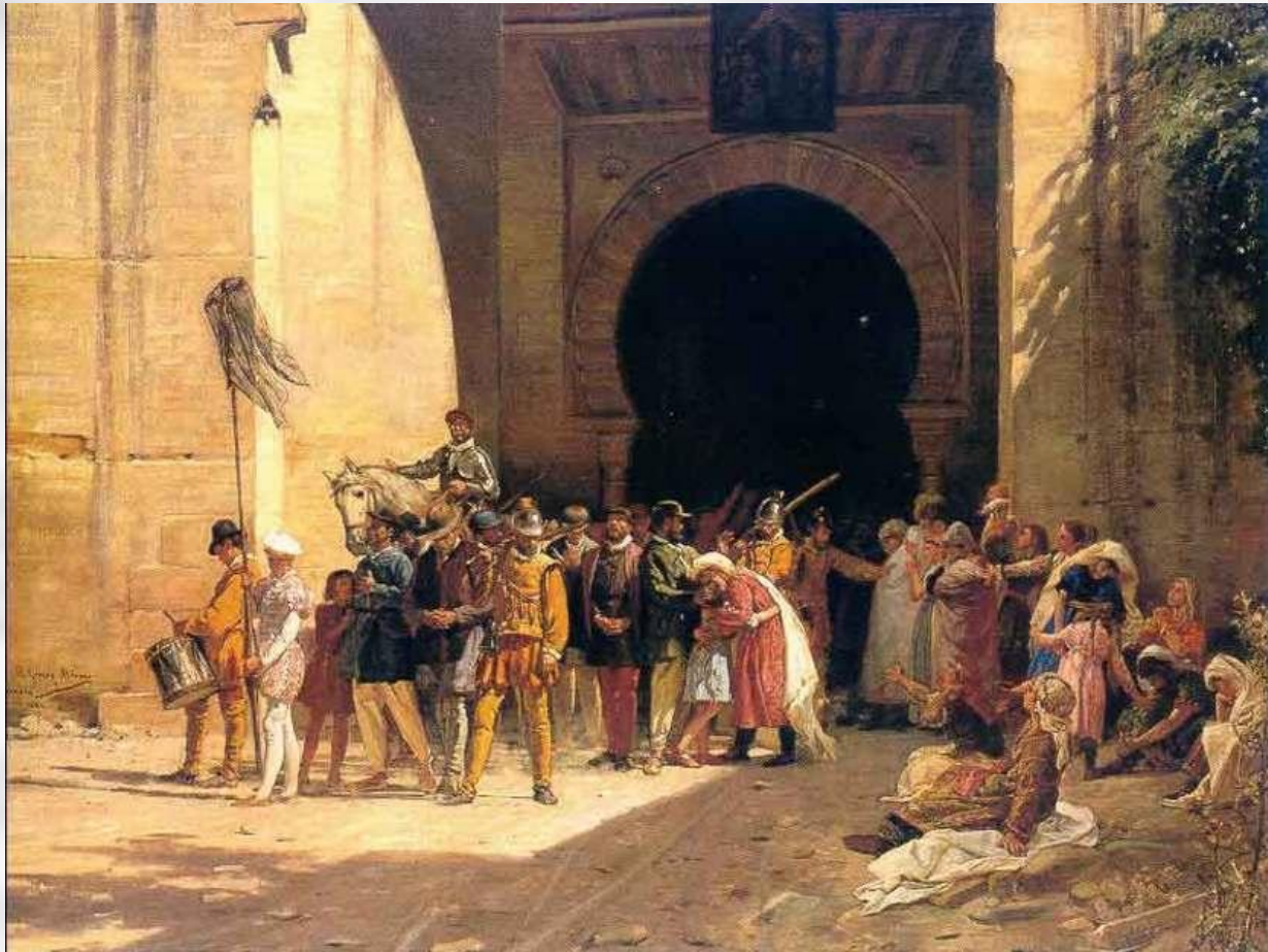
Изгнание мавров из Испании

На Пиренеях ещё с римских времён проживало много евреев. Возник один из центров еврейской культуры Средневековья. Отношение к евреям долгое время было намного лучше, чем в других странах. Но с конца XIV века, начались преследования и травля как евреев, и оставшихся мавров.