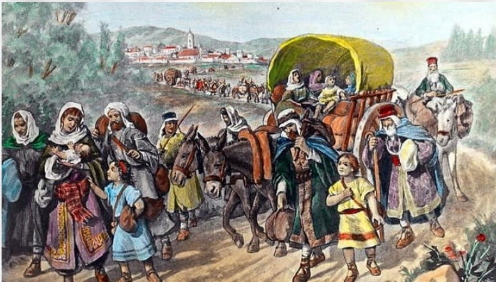
Изгнание евреев из Испании

Король и королева издали указ об изгнании всех евреев из Испанского королевства. 120 тысяч человек должны были в течение трёх месяцев покинуть страну. Оставив дома и имущество, Испанию покинула значительная часть торговцев и ремесленников, что оказалось для страны тяжёлой потерей.