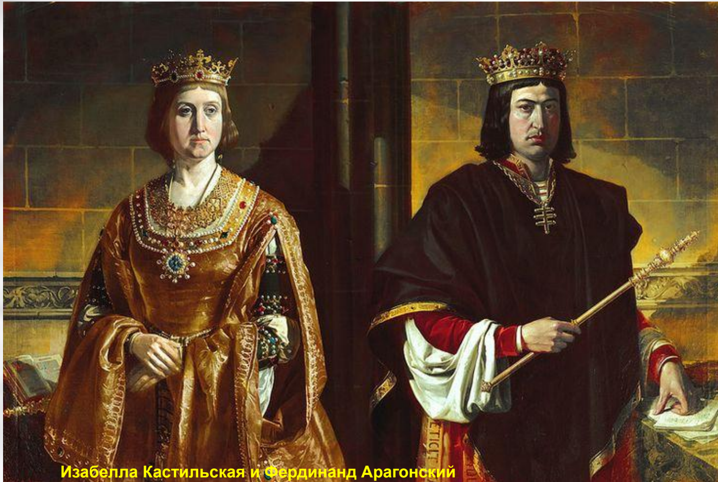
Изабелла Кастильская и Фердинанд Арагонский

После успехов Реконквисты начались междоусобные войны между христианскими государствами. Только в 1479 году под властью супружеской пары Изабеллы Кастильской и Фердинанда Арагонского произошло объединение двух государств в единое Испанское королевство. Наварра была поделена между Арагоном и Францией.