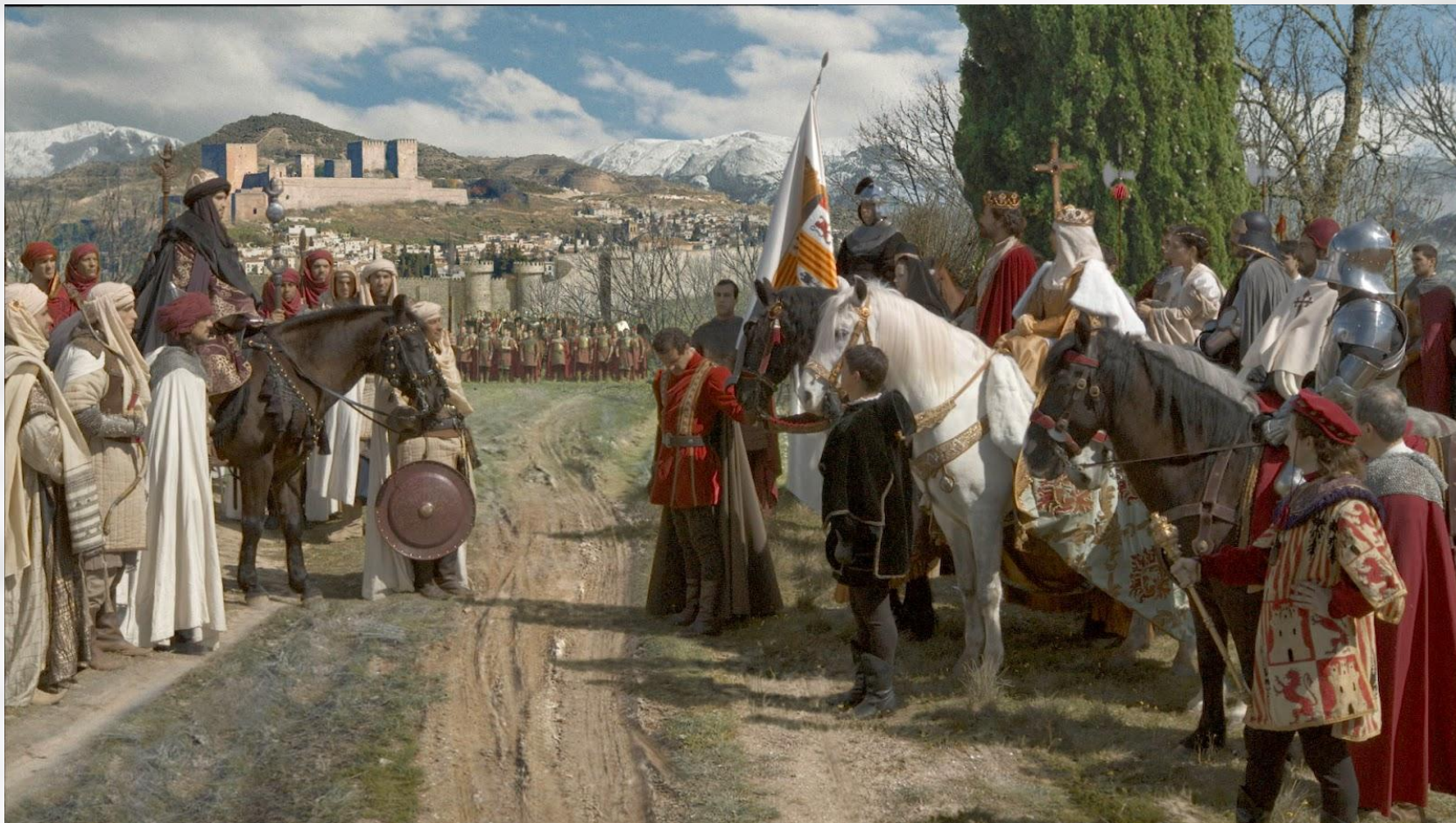
Передача ключей от Гранады

Реконкиста проводилась под лозунгом борьбы христиан против ислама. Мавры сдали Гранаду при условии, что за ними и евреями сохраняются их имущество и вера, но эти обещания не были выполнены.