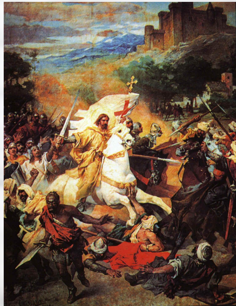
Сражение у селения Лас Навас де Толоса