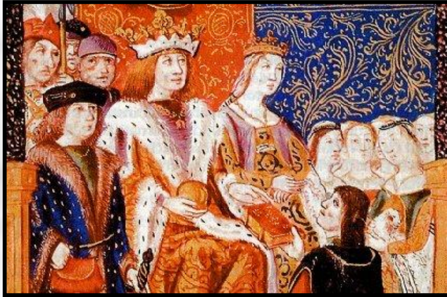
Фердинанд и Изабелла со своими подданными

В 1492 году после 10-летней войны войска Фердинанда и Изабеллы взяли Гранаду. На Пиренейском полуострове остались два христианских королевства - Испания и Португалия. Мавры были полностью изгнаны из Испании.