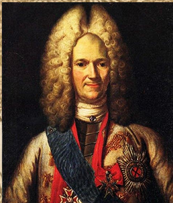
А.Д. Меншиков Первый министр