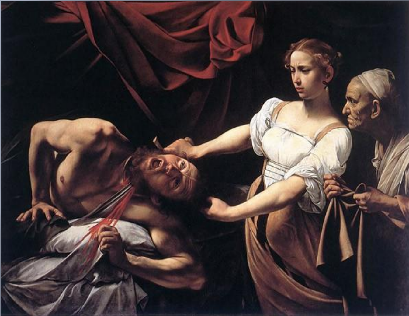
Юдифь и Олоферн