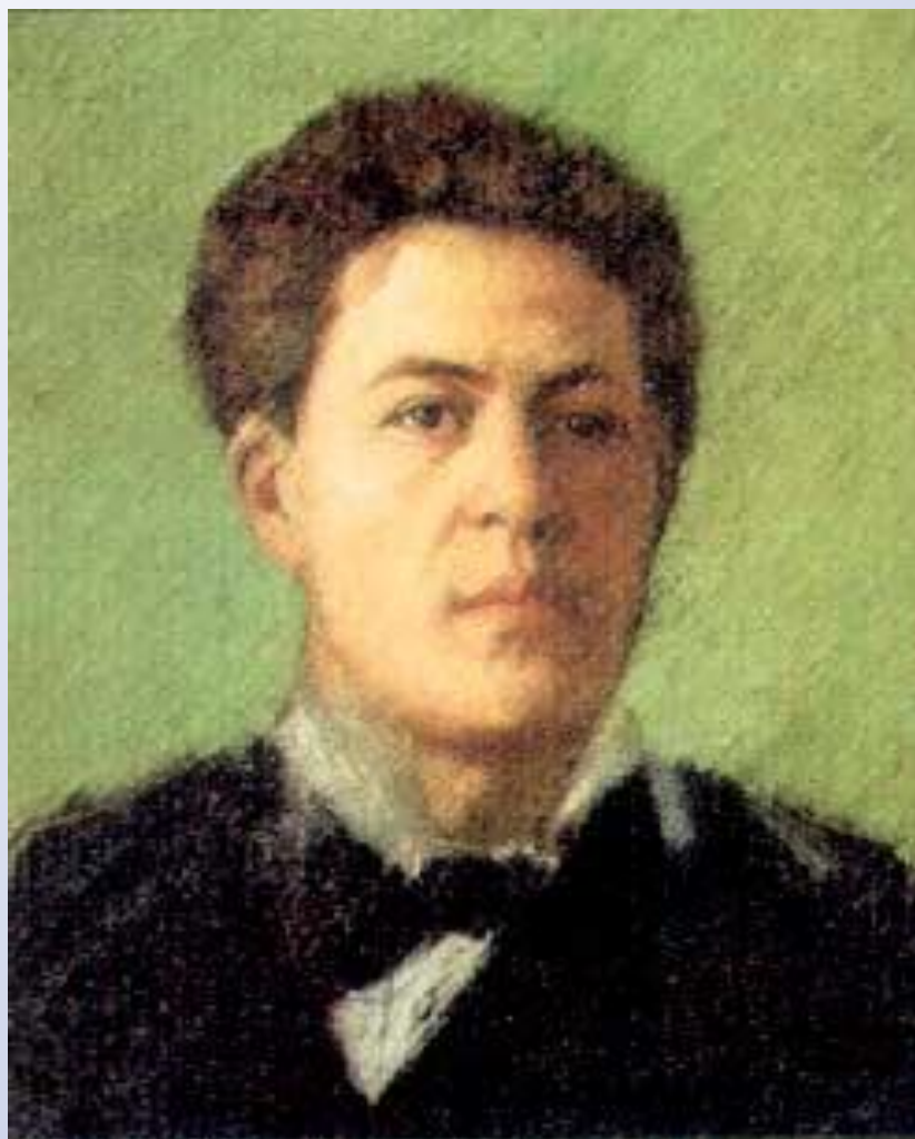
Портрет молодого А.П. Чехова