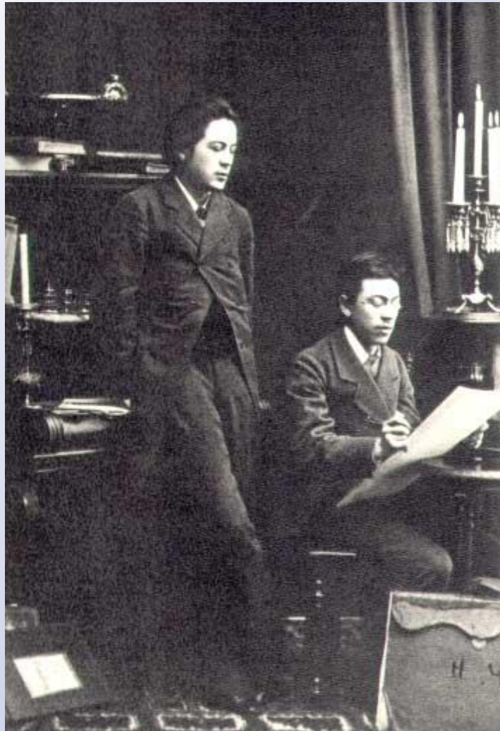
Антон Чехов с своим братом – художником Николаем Чеховым.