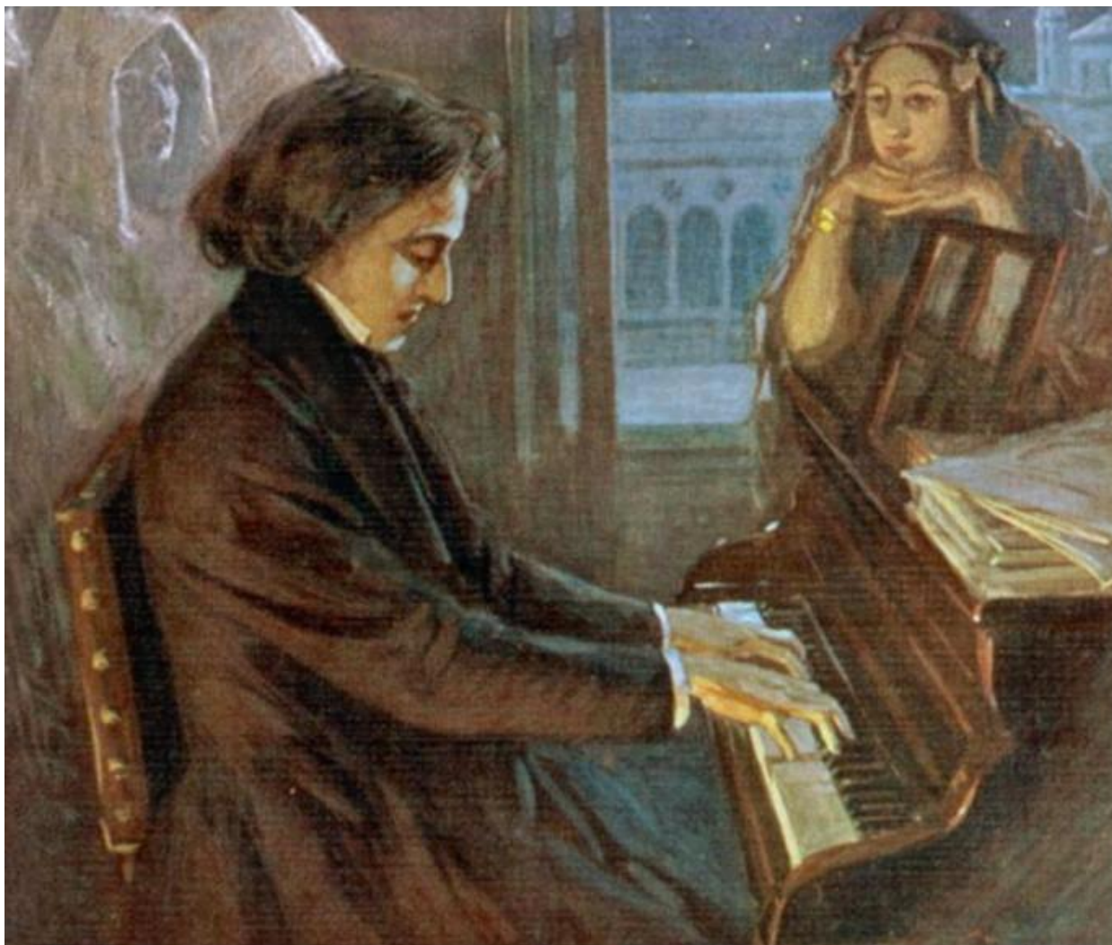
Баллада №1 Ф.Шопен