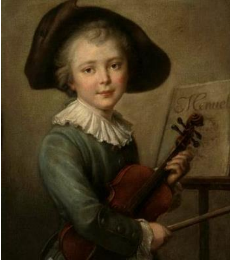
Ф.Шопен в детстве