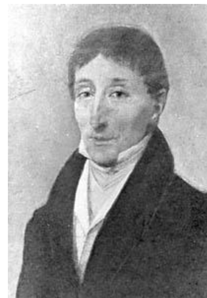
Войцех Живный первый учитель Фредерика Шопена. 13 мая 1756 г., Чехия 21 февраля 1842 г.