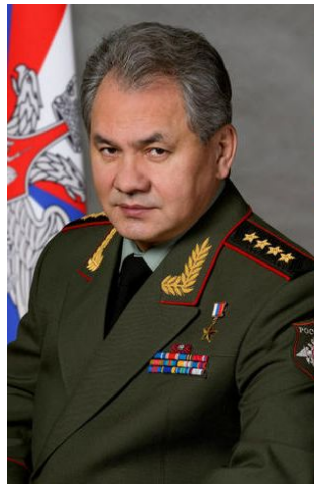
Шойгу Сергей Кужугетович Министр обороны Российской Федерации, генерал армии

Непосредственное руководство ВС РФ осуществляет Министр обороны РФ через Министерство обороны. Министерство обороны реализует политику в области строительства ВС РФ в соответствии с решениями высших органов государственной