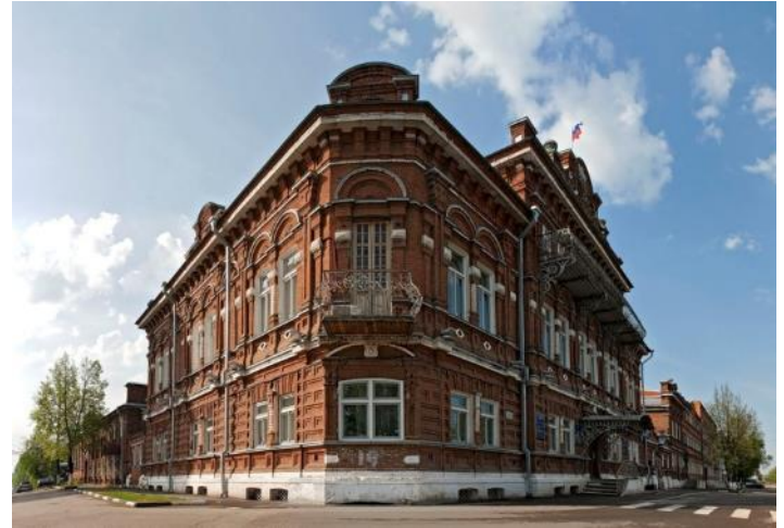
Усадьба купца Дубинина