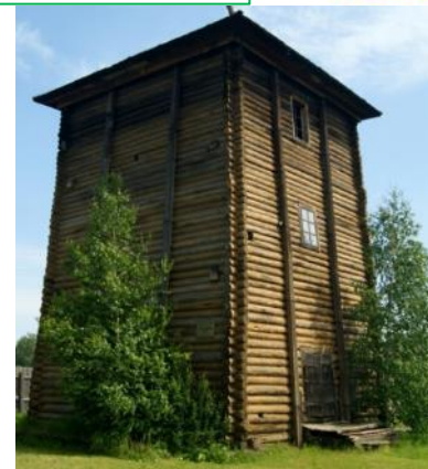
Рассолоподъемн ая башня