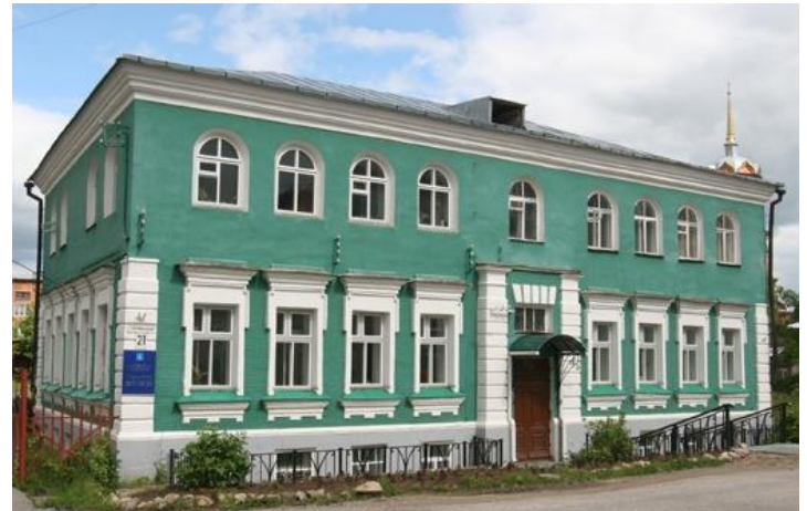
Усадьба купцов Юхневых.