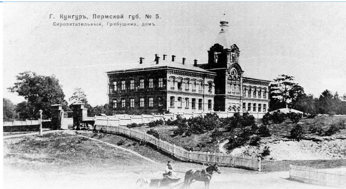
Г. Кунгурь, Пермской губ. № 5. Сиропитательный, Грибушина, домъ