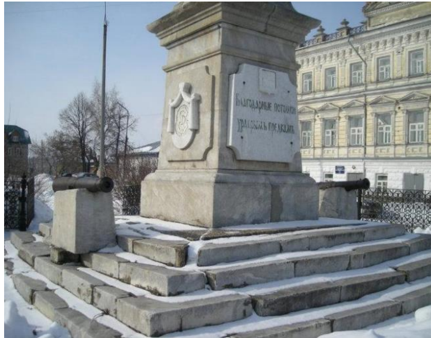
Обелиск в честь защитников Кунгура от войск Пугачёва