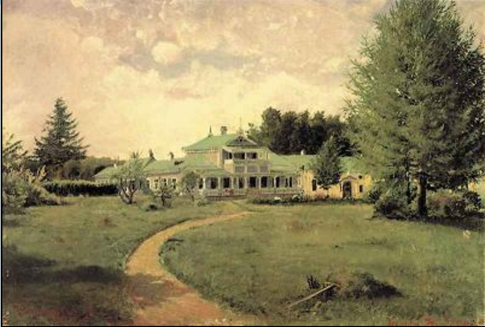
Картина Я.П.Полонского «Усадебный дом И.С.Тургенева». 1881 год