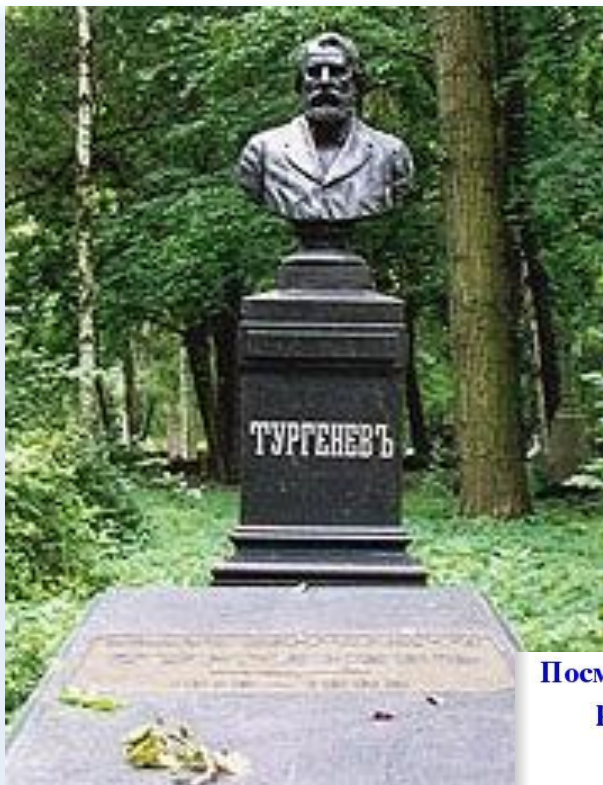
Посмертная маска и слепок руки И.С.Тургенева