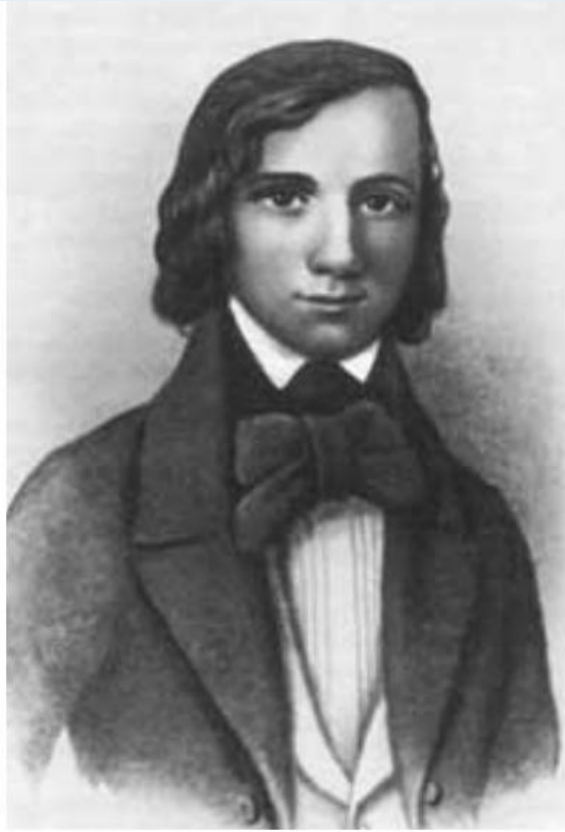
Иван Сергеевич Тургенев