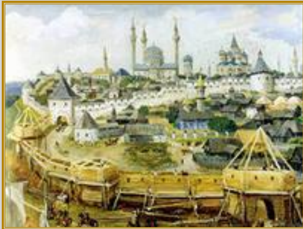
Казань в XVI веке

Зимний поход 1549/1550 года готовился гораздо тщательней. На этот раз основные силы подошли к Казани, но даже многочисленная артиллерия не принесла успеха - неожиданная распутица, не позволили применить ее, и превратили в бессмыслицу любую попытку штурма.