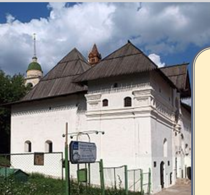
Старый английский двор в Москве

1553 г. – в устье Северной Двины прибыл первый английский корабль