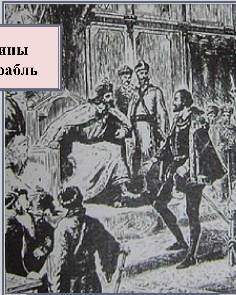
Иван Грозный принимает капитана Ричарда Ченслора. 1553 г.

1555 г. – в Москве создана английская торговая компания