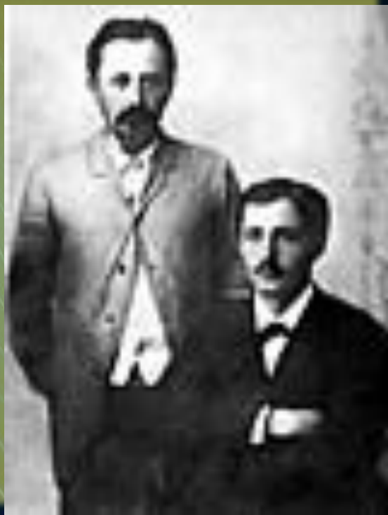
Ю.А. и И.А. Бунины. Полтава. 1891

Сотрудничал он и в газете "Киевлянин". Теперь стихи и проза Бунина стали чаще появляться в "толстых" журналах - "Вестник Европы", "Мир Божий", "Русское богатство" - и привлекали внимание корифеев литературной критики. Н. К. Михайловский хорошо отозвался о рассказе "Деревенский эскиз" (позднее озаглавленный "Танька") и писал об авторе, что из него выйдет "большой писатель". В эту пору лирика Бунина приобрела более объективный характер ; автобиографические мотивы, свойственные первому сборнику стихов (он вышел в Орле приложением к газете "Орловский вестник" в 1891 году ) , по определению самого автора, не в меру интимных, постепенно исчезали из его творчества, которое получало теперь более завершенные формы.