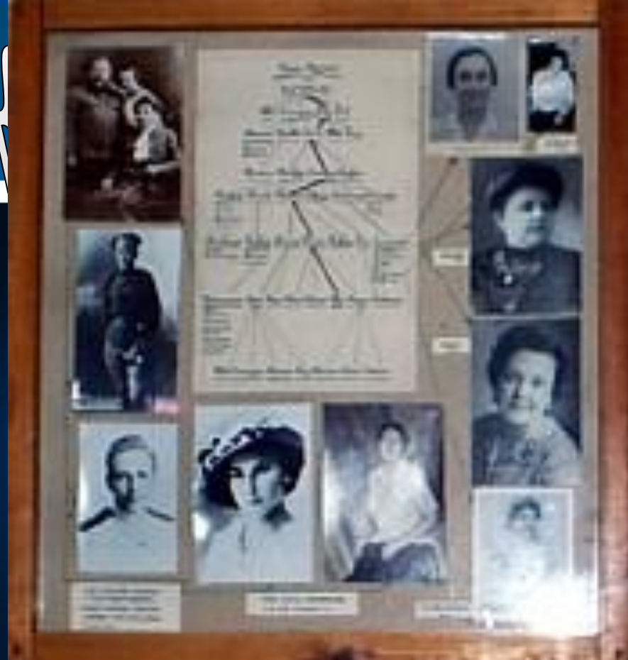
Портрет Анна Бунина. Генеологическое древо семьи Буниных

Свою собственную биографию Бунин почти всегда и неизменно начинает цитатой из "Гербовника дворянских родов": "Род Буниных происходит от Симеона Бутковского, мужа знатного, выехавшего в Х VI из Польши к Великому Князю Василию Васильевичу.»