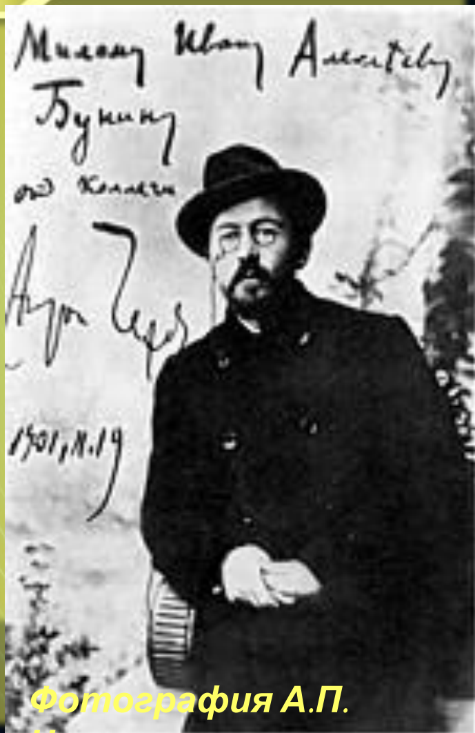
Фотография А.П. Чехова