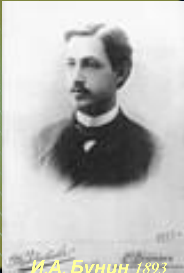
И.А. Бунин 1893