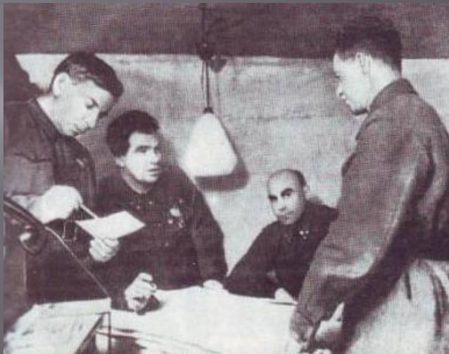
В штабе 62-й армии: Н.И.Крылов, В.И. Чуйков, К.А.Гуров, А.И.Родимцев

17 июля 1942 года передовые части фашистской группы армий «Б» в большой излучине Дона встретились с войсками Сталинградского фронта. Началась Сталинградская битва.