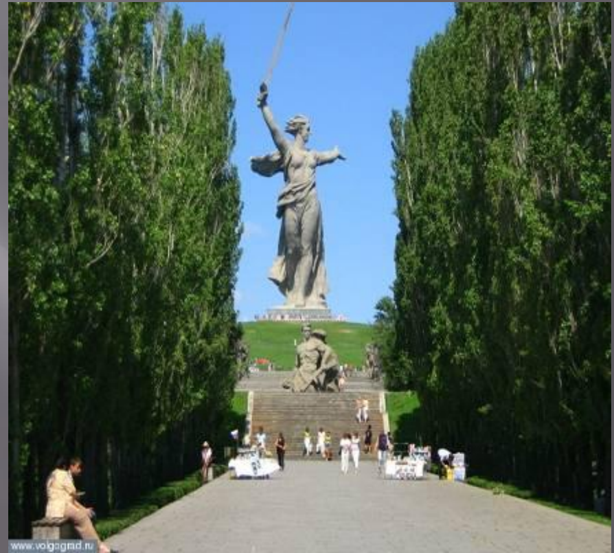
Мемориальный комплекс на Мамаевом кургане

Название мамаев курган, как гласит легенда, связано с именем татарского военачальника Мамаю.