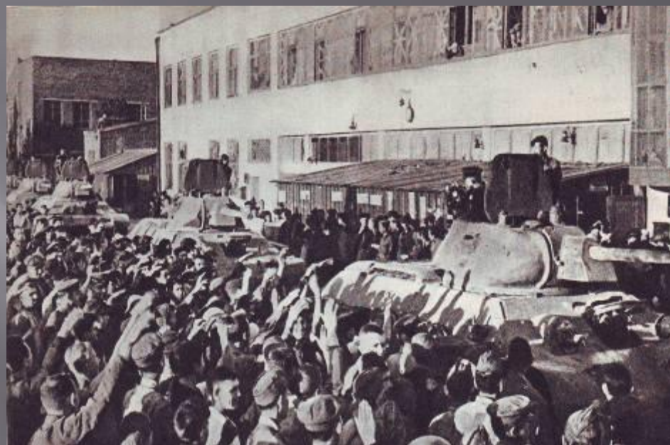
Танки с завода уходят на фронт

Сталинградский тракторный приступил к выпуску танковых моторов, артиллерийских тягачей и средних танков Т-34.