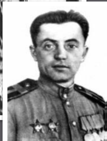
Яков Федорович Павлов