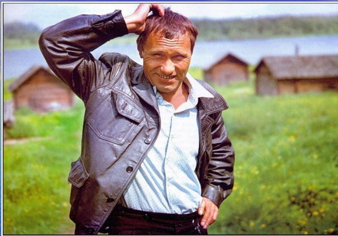
В.М. Шукшин (1929- 1974)