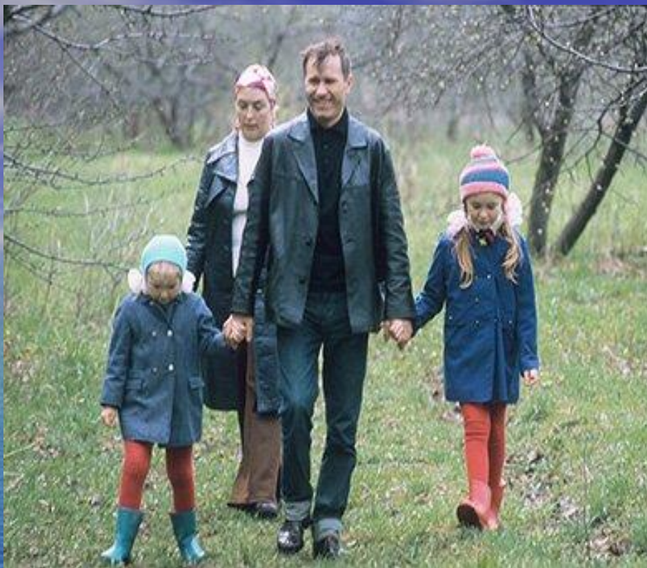
Василий Шукшин с семьей, 1974 год...