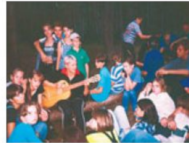
культурно проводити дозвілля