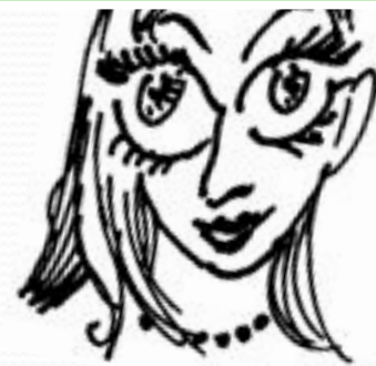
Делать большие глаза