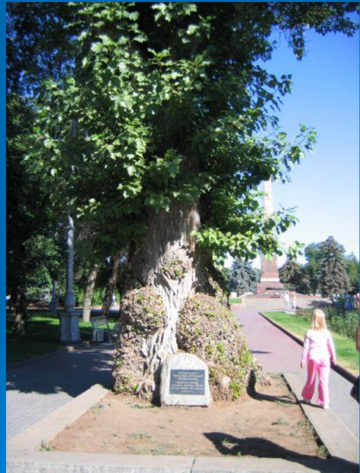
На фото: Тополь на Аллее Героев

Тополь на Аллее Героев — исторический и природный памятник Волгограда. Расположен в Центральном районе на Аллее Героев рядом с «Вечным огнём» и памятником Рубену Ибаррури. Тополь, выживший в центре Сталинградской битвы — живой свидетель истории. Имеет на своем стволе многочисленные свидетельства военных действий.