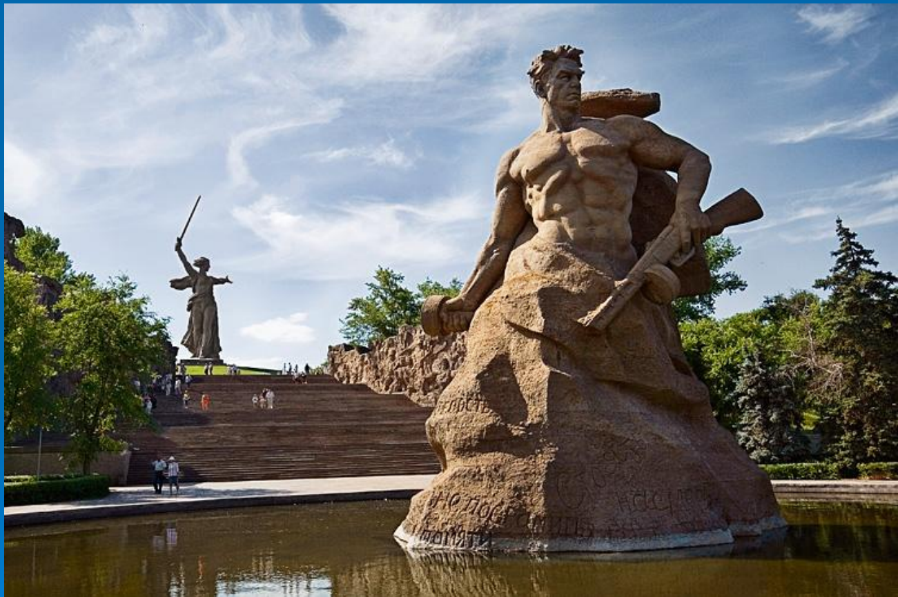
На фото: Мамаев Курган

Мамаев курган расположен в Центральном районе города Волгограда, где во время Сталинградской битвы происходили ожесточённые бои (особенно в сентябре 1942 года и январе 1943) продолжительностью 200 дней.