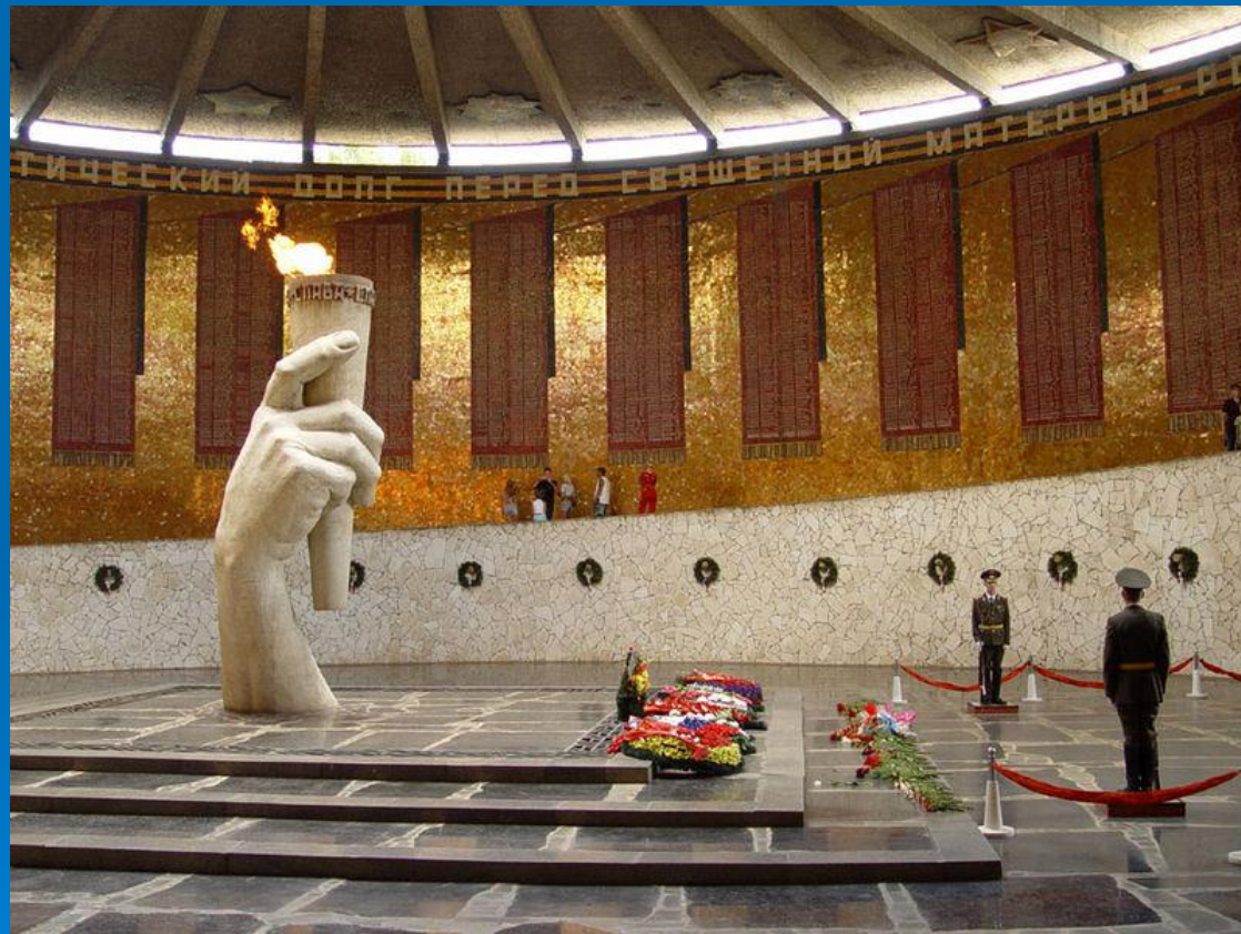
На фото: Вечный огонь

Мамáев кургáн расположен в Центральном районе города Волгограда, где во время Сталинградской битвы происходили ожесточённые бои (особенно в сентябре 1942 года и январе 1943) продолжительность ю 200 дней.