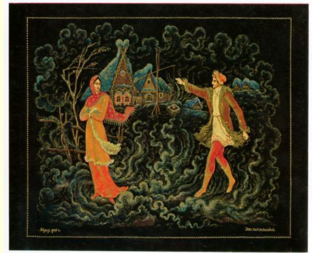
И. А. Челышев. Метель. Таблица 43.