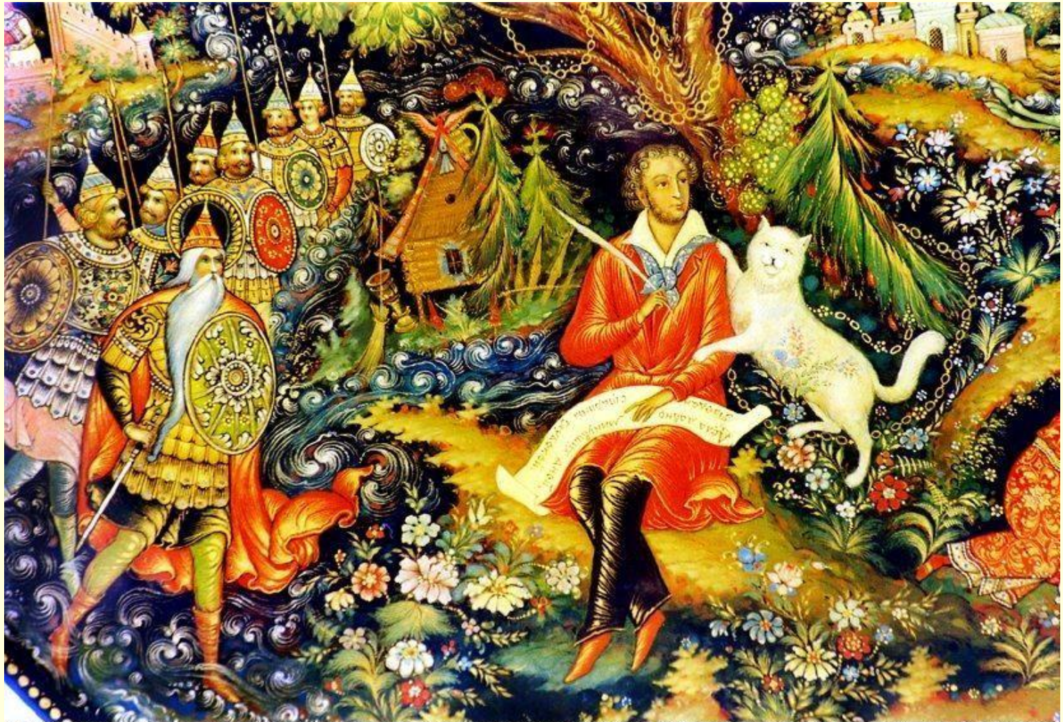
An original Russian Black Lacquer Plate painted by Bakalovii (husband & wife) of PALEKH, illustrating Pushkin's Tale "Lukomorye" - From the Elsner Col