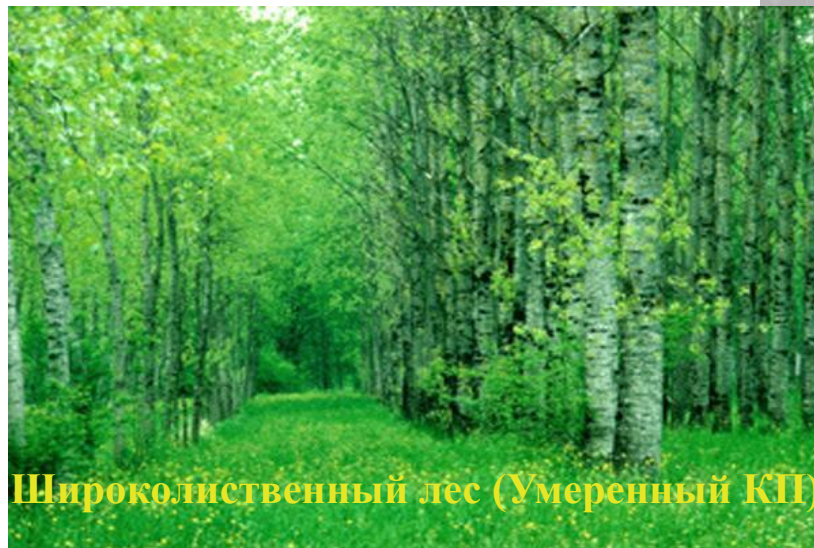
Широколиственный лес (Умеренный КП)