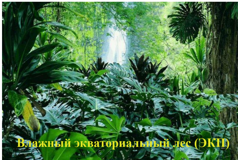
Влажный экваториальный лес (ЭКП)