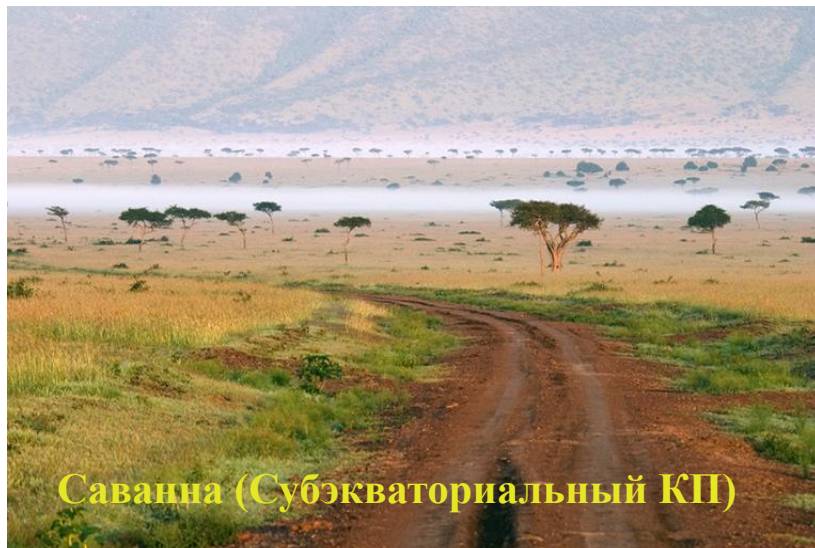
Саванна (Субэкваториальный КП)