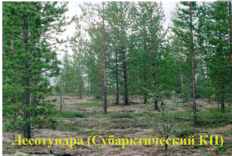
Лесотундра (Субарктический КП)