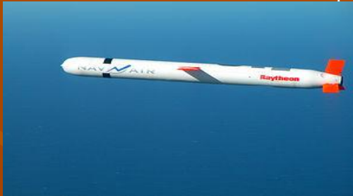
Крылатая ракета «Томагавк»