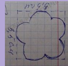
Бусинки и тычинки