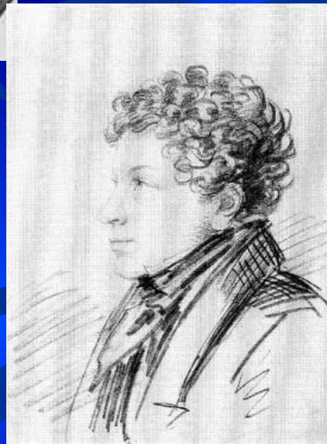
Брат поэта, Лев Сергеевич Пушкин