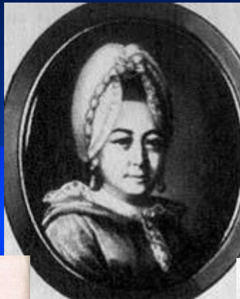
Бабушка Пушкина, Мария Алексеевна Ганнибал