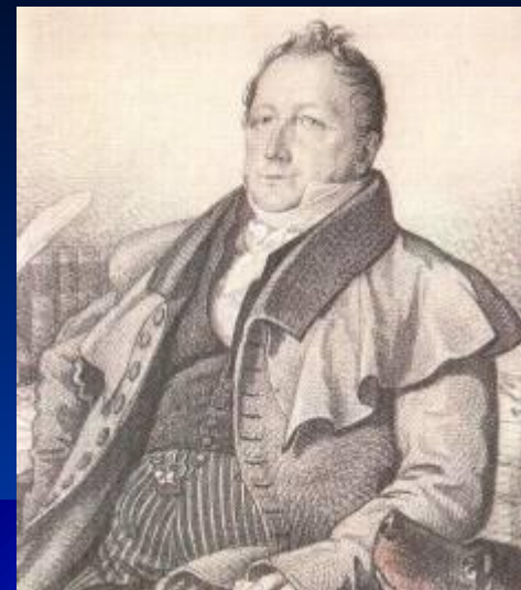
Сергей Львович Пушкин – отец поэта