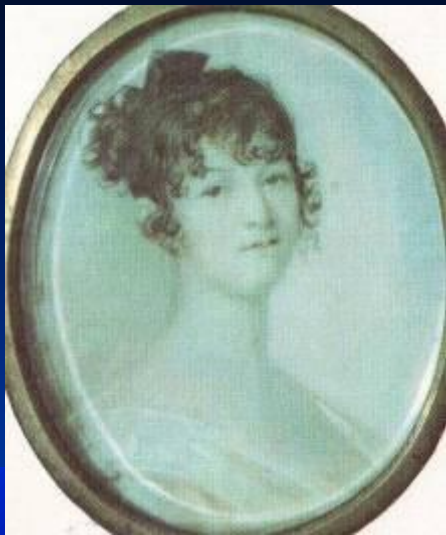
Надежда Осиповна Пушкина – мать поэта