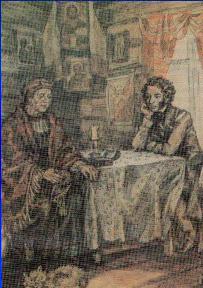
Пушкин и Арина Родионовна

Россия еще не поставила памятника Арине Родионовне, Великой Няне поэта. Затерялась ее могила... А ведь часть ее души - в поэте, в его «заветной лире», вся поэзия А. С. Пушкина освящена ею, крестьянской женщиной... Она — его Родина.