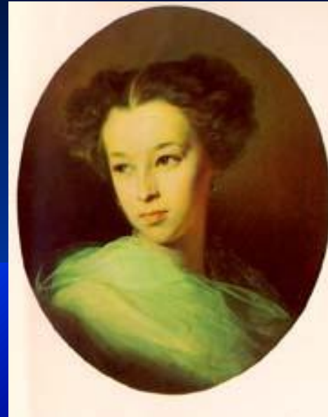
Дочь Наталья Александровна Пушкина