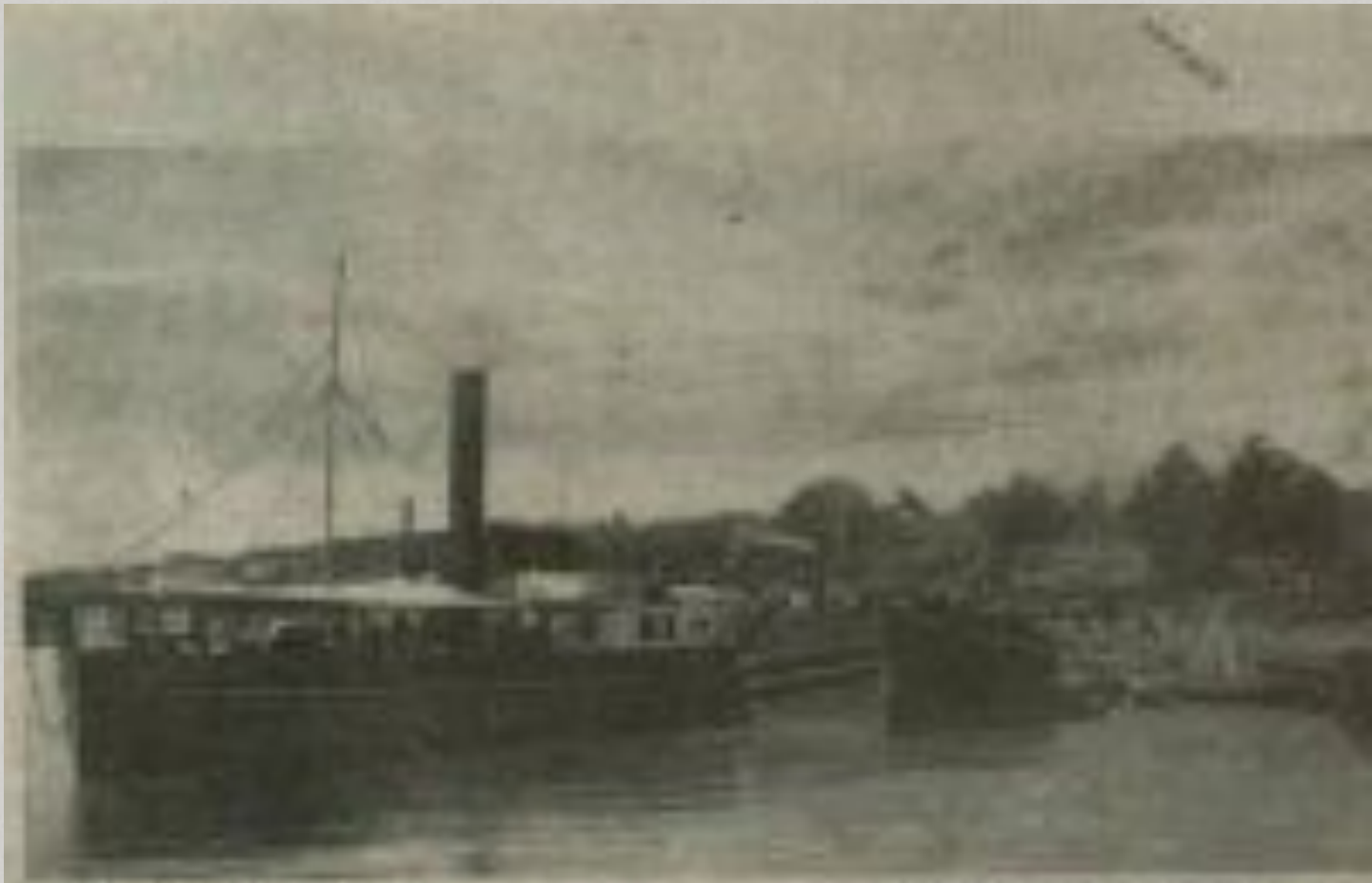
Ныссина, Корабль "Гиметос". Лодка на реке в Дрезде.