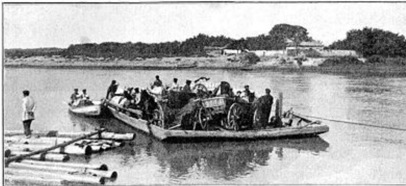
Переправа на поромъ черезъ р. Днѣстръ.