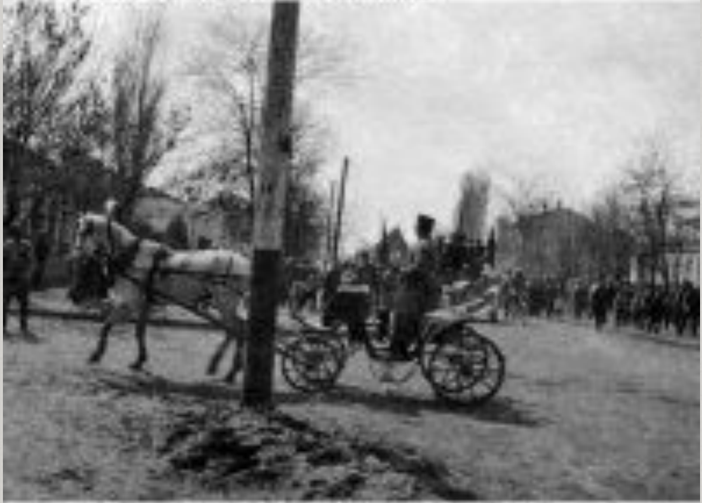
Кремль, Москва, 1917 г. На улице Кремля – армия и народ