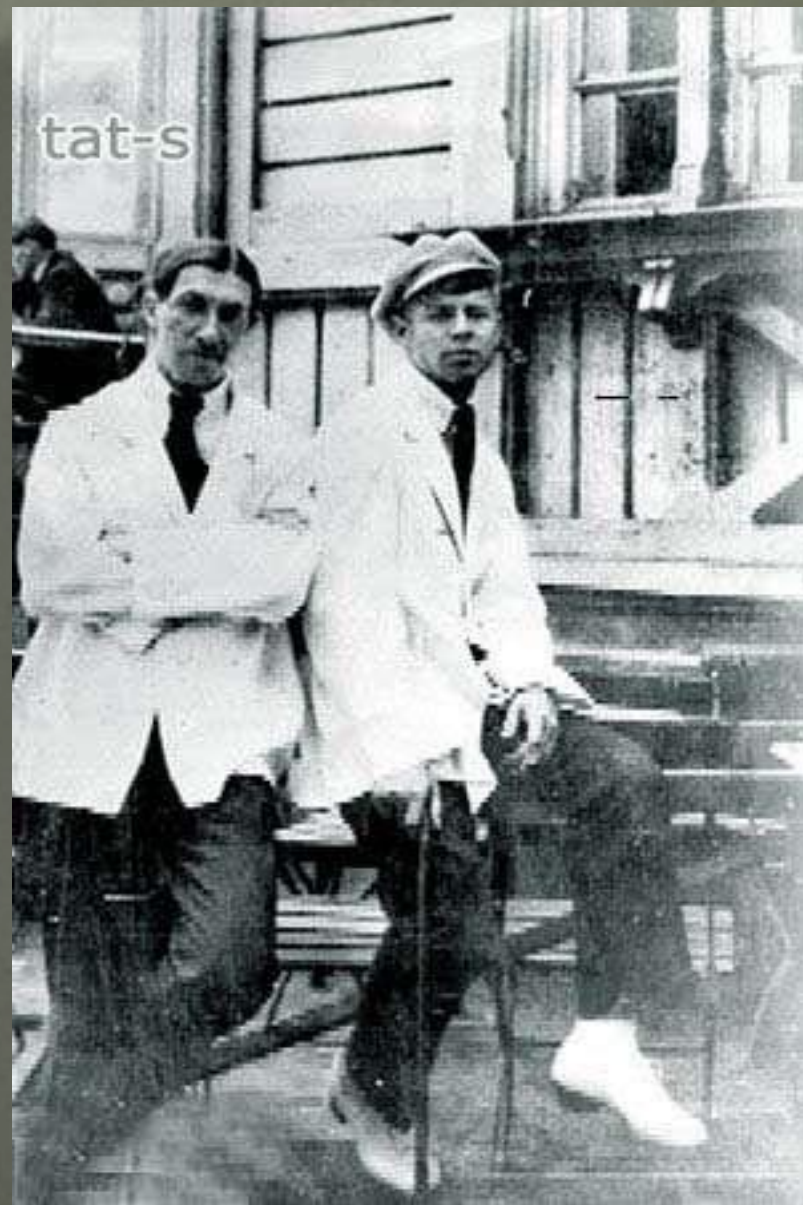
Фото - 1921 год.

Сергей Есенин (справа) и Анатолий Борисович Мариенгоф (1897 - 1962).