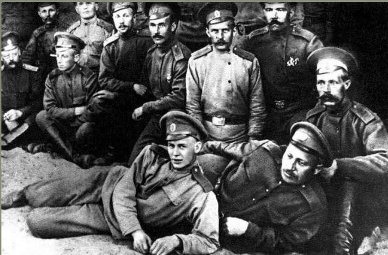
С. А. Есенин среди персонала полевого Царскосельского военно-санитарного поезда № 143. 1916 г., июнь. Черновцы.

В январе 1916 года Есенина призвали на военную службу. Весной молодого поэта приглашают читать стихи императрице, что в будущем помогает ему избежать фронта.