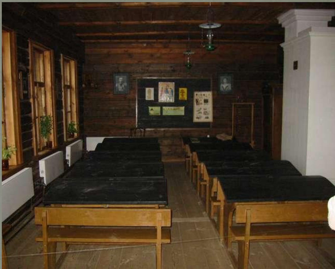
С. Константиново. Школа, где учился Есенин

В 1904г. Сергея Есенина поступил в Константиновскую земскую школу, где он учился пять лет. В 1909г. окончил земскую школу и родители определили Сергея в церковно-приходскую школу в селе Спас-Клепики. В 1912г. Сергей Александрович Есенин, окончив учительскую школу, переехал в Москву и поселился у отца в общежитии для приказчиков. Отец устроил Сергея работать в контору, но вскоре Есенин ушёл оттуда и устроился работать в типографию И.Сытина в качестве помощника корректора.