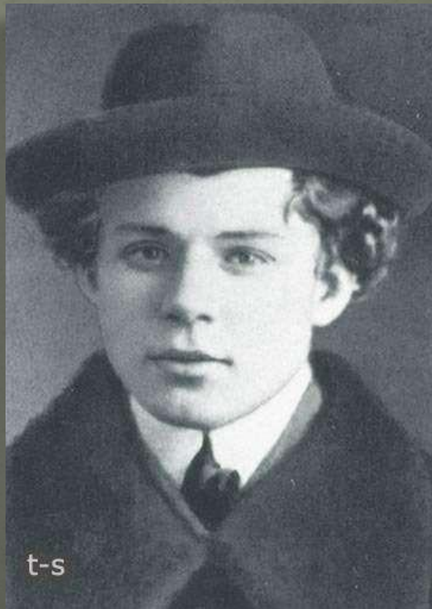
Сергей Есенин, 18 лет, 1913 год

В Семнадцать лет уехал в Москву, где работал корректором в типографии; продолжал писать стихи. В 1912 году поступил в Народный университет А.Шанявского на историко-философское отделение, где проучился полтора года.