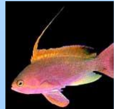
Рыба, обитающая на большой глубине