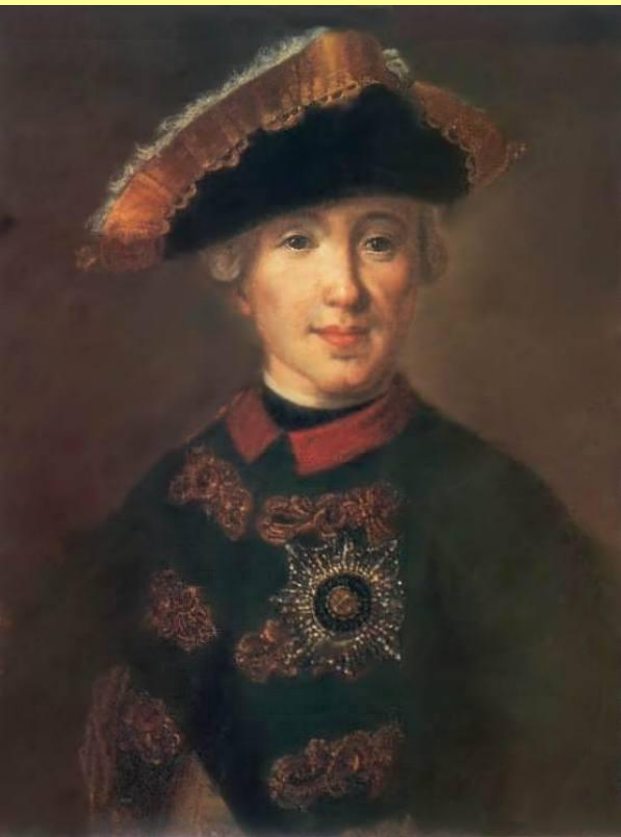
Император Петр III. Худ. Ф.С. Рокотов.

Петр III прекратил преследование раскольников. Он издал указ о секуляризации церковных земель и передаче их в распоряжение коллегии экономии. В Сенат был направлен указ об уравнивании всех религий. Петр III даже прислал в Синод указ, повелевавший православным священникам обрить бороды и надеть вместо ряс сюртуки.