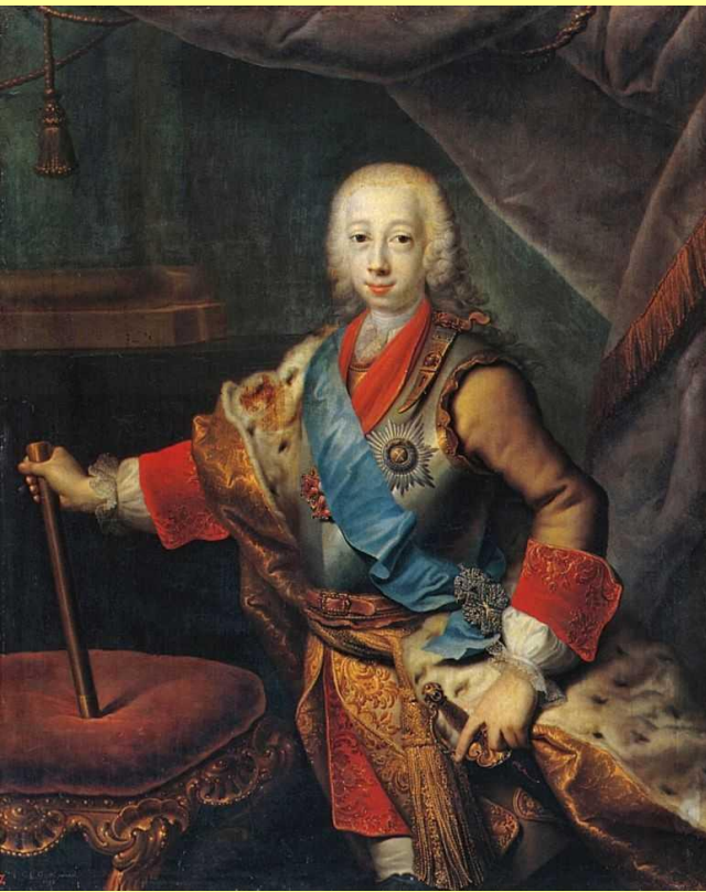
Портрет великого князя Петра Федоровича. 1743 г. Худ. Г.К. Гроот.

Почти сразу воцарения Елизавета вывезла из Гольштейна племянника Карла Петера Ульриха – сына Анны Петровны.