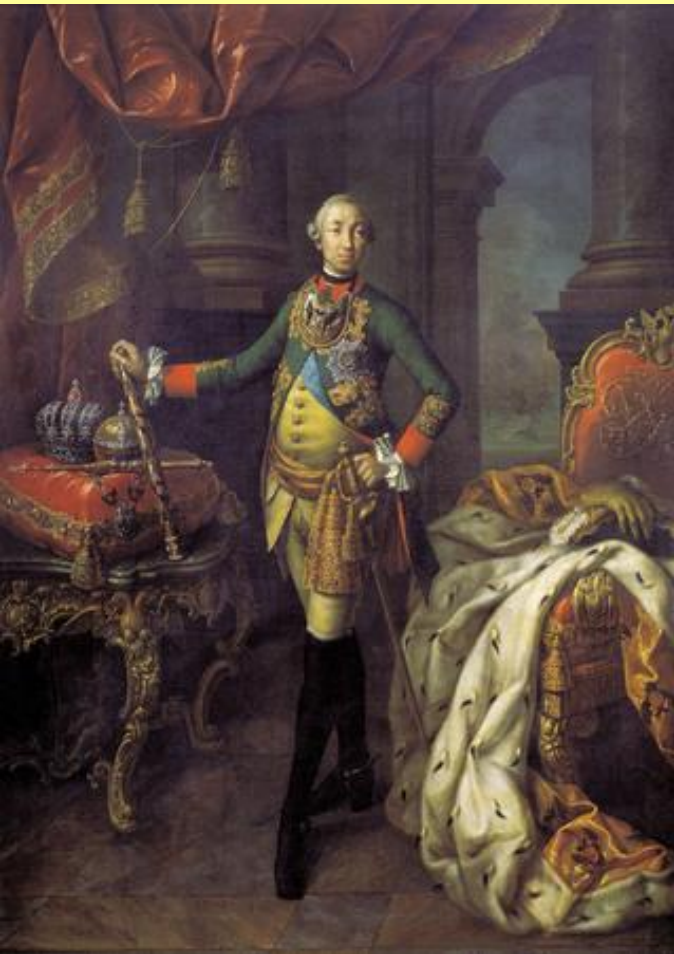
Император Петр III. Худ. А.П. Антропов.

Указом 21 февраля 1762 г. Петр III упразднил Тайную канцелярию. Одновременно предписывалось: «Ненавистное выражение, а именно: слово и дело не долженствует отныне значить ничего». Само употребление этих слов запрещалось, а нарушителей полагалось наказывать как «озорников и безчинников».