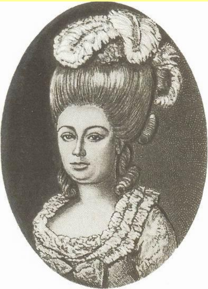
Портрет Елизаветы Романовны Воронцовой. Неизв. художник.

Растущим раздражением против Петра III воспользовалась его жена Екатерина Алексеевна.