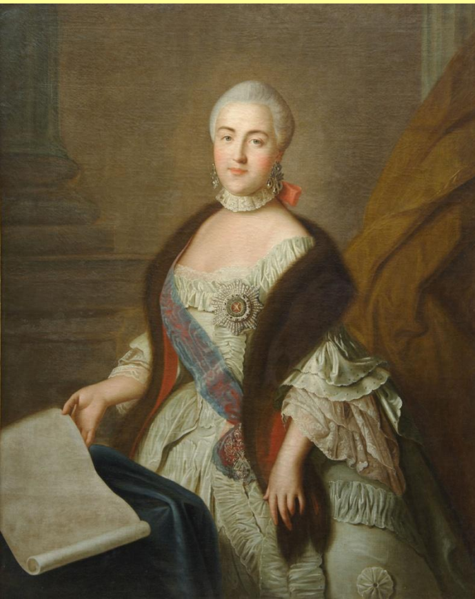
Портрет великой княгини Екатерины Алексеевны. Худ. И.П. Аргунов.

Екатерина, умная, упорная, властная, давно глубоко презирающая мужа, фактически возглавила заговор против него.