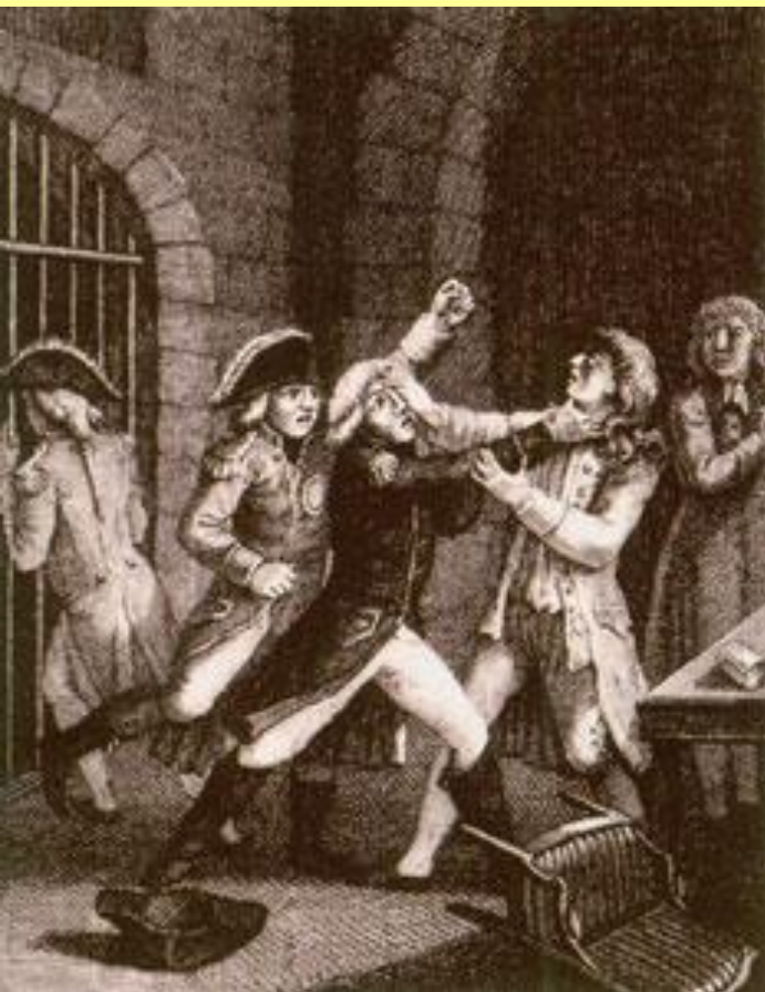
Убийство Петра III в Ропше.

Петра III арестовали и содержали под охраной в замок в Ропше.