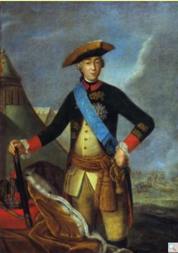
Император Петр III. Худ. Ф.С. Рокотов.

Манифест о вольности дворянства впервые создал в России слой свободных, не зависящих от государства людей.