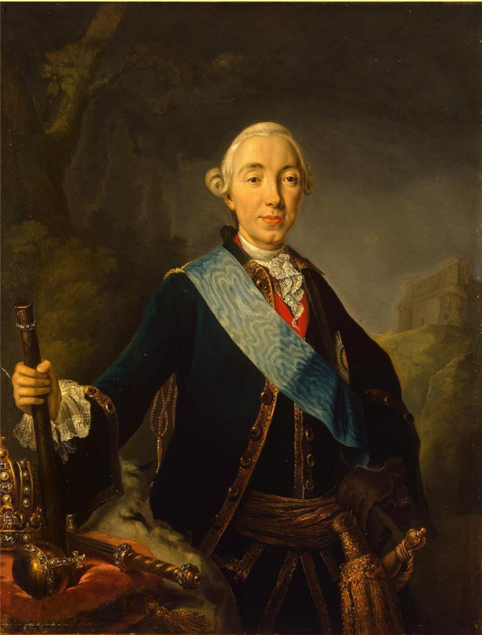
Император Петр III. Коронационный портрет. Худ. Л.К. Пфанцельт.

После рождения и Петра и Екатерины сына Павла императрица Елизавета всерьез подумывала объявить внучатого племянника наследником, а его родителей выслать его из России. Есть сведения, что к такому решению Елизавету подталкивали Шуваловы. Однако Елизавета так и не решилась (или не успела) пойти на такой шаг, а после ее смерти Шуваловы предпочли не рисковать.