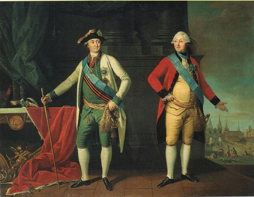
Портрет Г.Г. и А.Г. Орловых. Худ. Ж.Л. Девельи. 1770-е гг.

28 июня 1762 г., когда Петр III был в Петергофе, заговорщики подняли гвардейские полки и провозгласили ее императрицей.