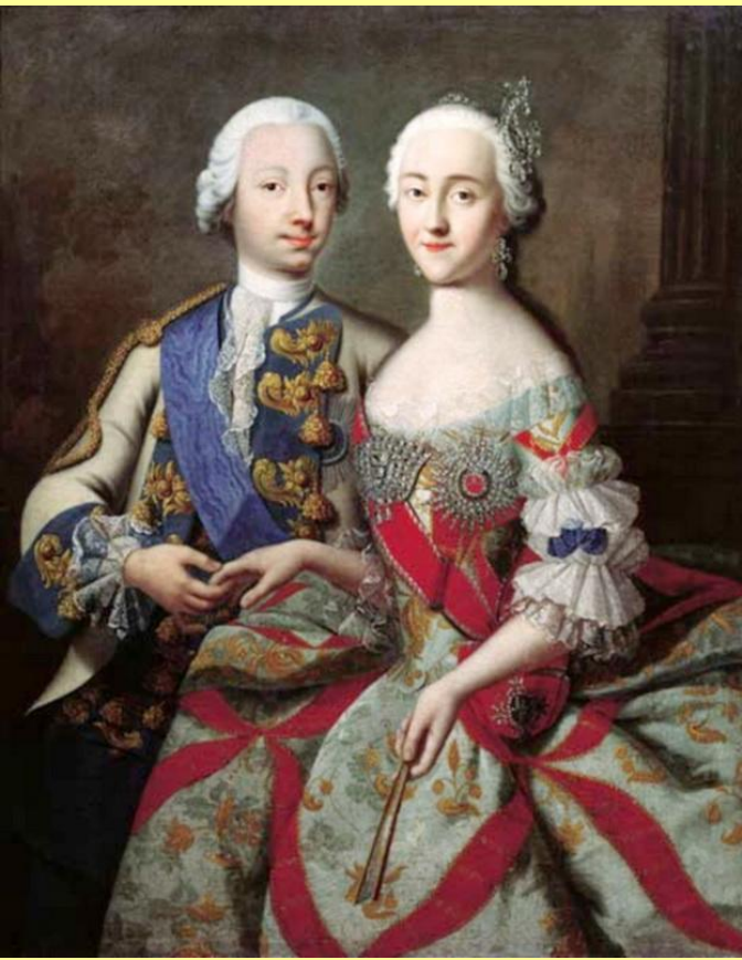
Портрет великого князя Петра Федоровича и великой княгини Екатерины Алексеевны. Худ. Г.К. Гроот.

Елизавета подобрала племяннику невесту – анхальт-цербстскую принцессу Софью-Августу-Фредерику. В 1745 г. 14-летняя девочка приехала в Россию и осталась здесь навсегда, приняв новое имя – Екатерина Алексеевна.