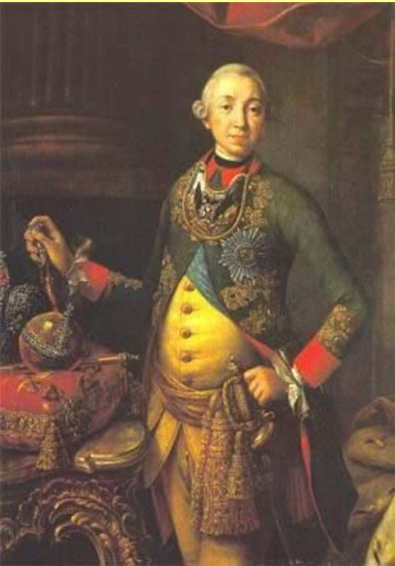
Император Петр III. Худ. А.П. Антропов.

Важнейшим документом царствования Петра III стал изданный 18 февраля 1762 г. Манифест «о даровании вольности российскому дворянству».