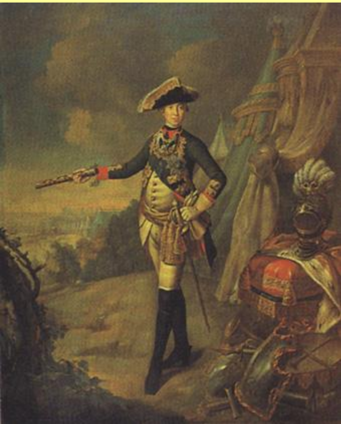
Портрет императора Петра III в военном лагере. Ок. 1762 г. Худ. А.П. Антропов.