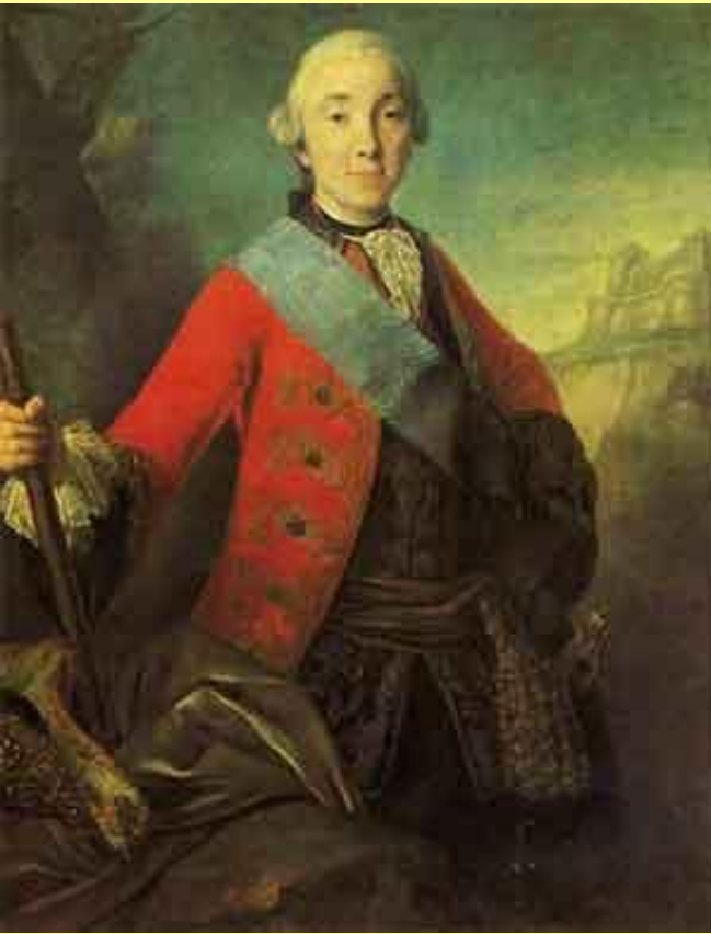
Портрет великого князя Петра Федоровича. 1758 г. Худ. Ф.С. Рокотов.

Карл Петер Ульрих был окрещен в православие, стал именоваться Петром Федоровичем и потерял права на шведский трон. Наследник разочаровал Елизавету: он был ленив, неразвит, инфантилен, открыто презирал Россию, православие, зато боготворил Пруссию и ее короля Фридриха II. Но другого наследника у Елизаветы не было: Петр был последним представителем династии Романовых хотя бы по женской линии.