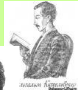
Вильгельм Карлович Кюхельбекер Акварель П. Л. Яковлева 1820-е годы