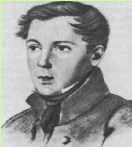
Ф. Ф. МАТЮШКИН. Рисунок неизвестного художника. 1816—1817.

Сидишь ли ты в кругу своих друзей Чужих небес любовник беспокойный? Иль снова ты проходишь тропик знойный И вечный лёд полунощных морей? Счастливый путь!.. С лицейского порога Ты на корабль перешагнул шутя, И с той поры в морях твоя дорога, О, волн и бурь любимое дитя!