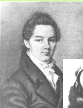
Пущин Иван Иванович Рисунок, пастель Ф. Верне 1817