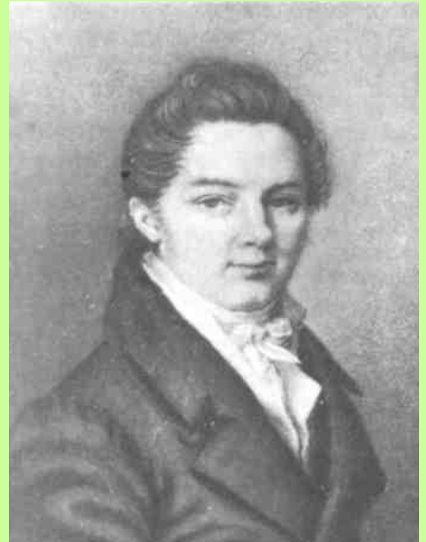
И. И. ПУЩИН.

«Мой первый друг, мой друг бесценный...»