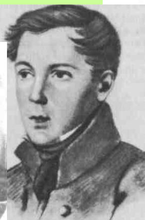
Ф. Ф. МАТЮШКИН. Рисунок неизвестного художника. 1816—1817.