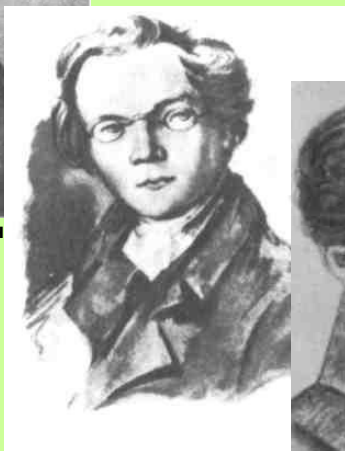
Дельвиг Антон Антонович Акварель П.Л. Яковлева 1816-1817