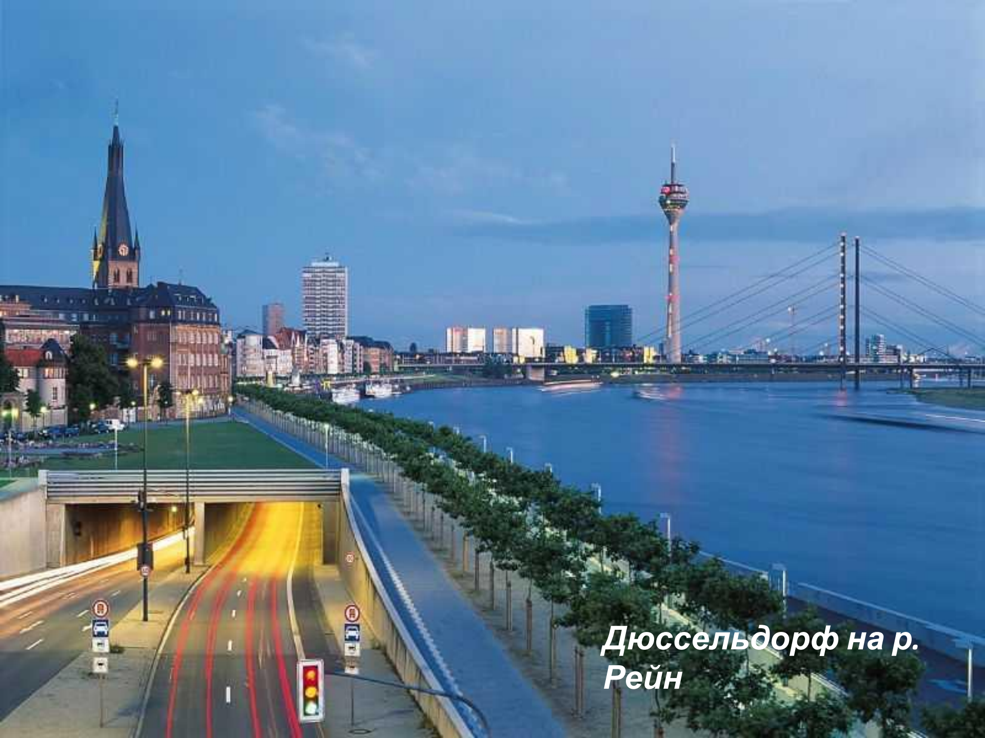
Дюссельдорф на р. Рейн