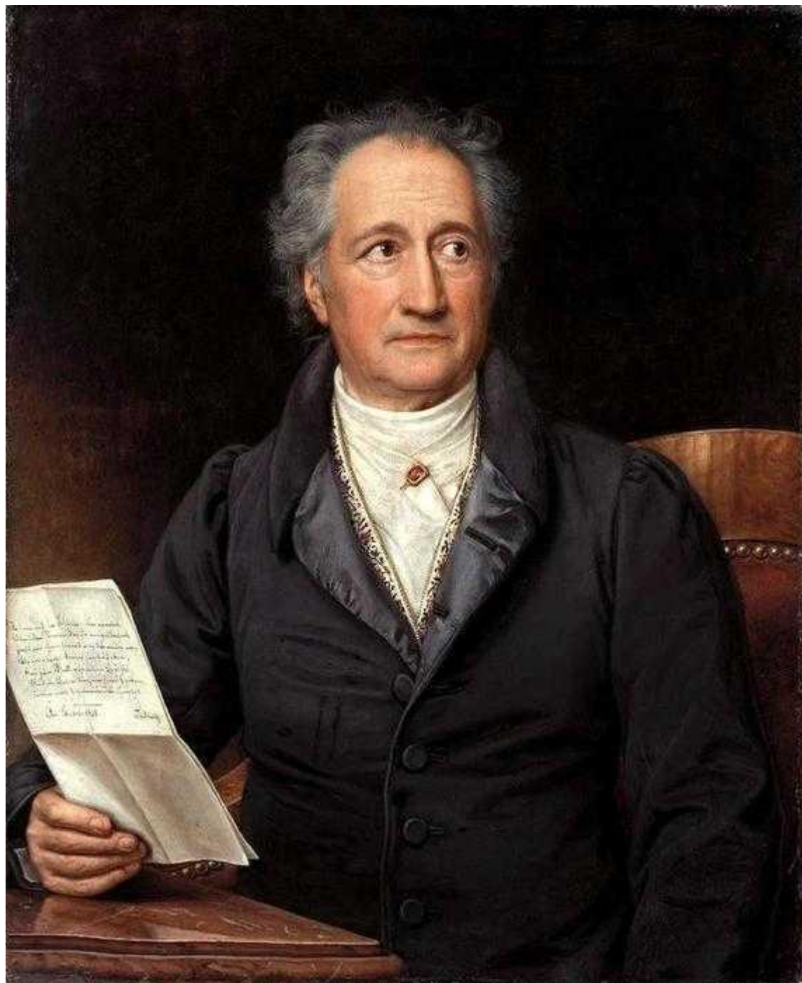
Иоганн Вольфганг Гете