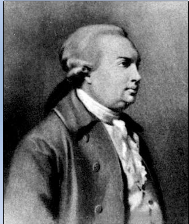
Неизвестный художник 18 века