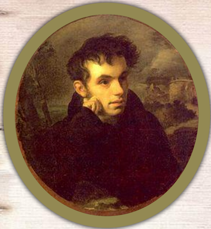
Василий Андреевич Жуковский (1783-1852)